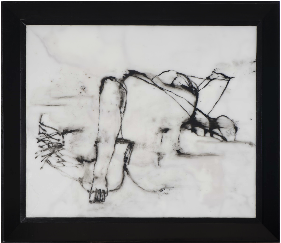
(Hi)Story[X]-IV-1 , 2014, 108x124 cm