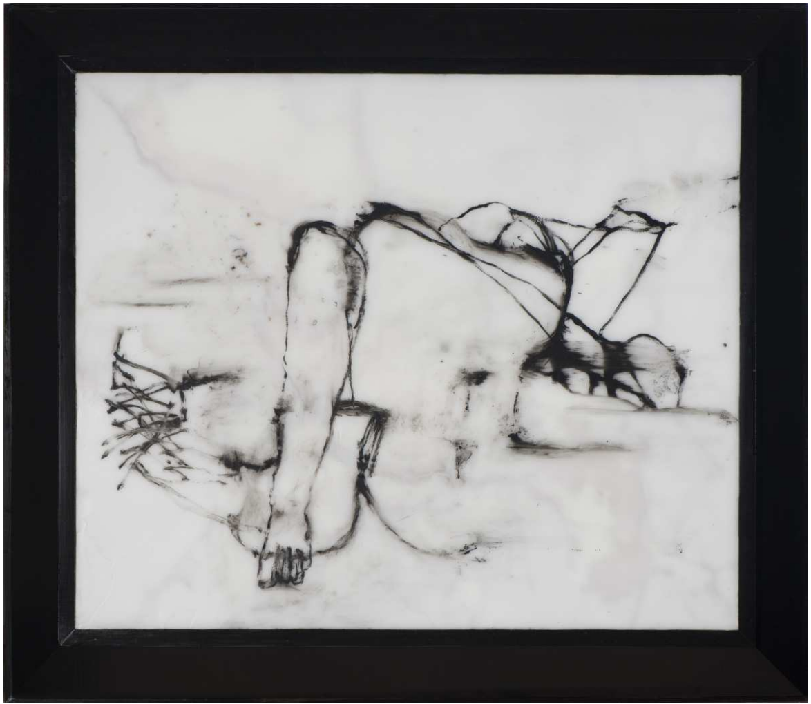
(Hi)Story[X]-IV-1 , 2014, techniques mixtes sur cire, 108x124 cm