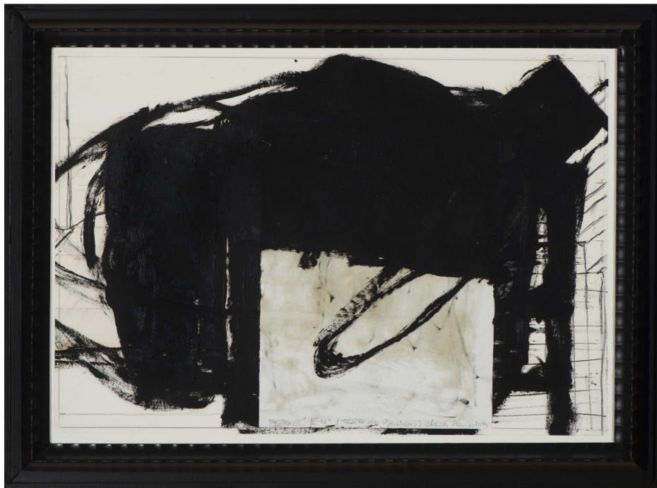
(Hi)Story[X]-IV-42 , 2014, techniques mixtes sur papier, 60x81 cm

Mathilde Hatzenberger Gallery Léon Lepagestraat 11 Rue Léon Lepage / 1000 BXL 00 32 (0)478 84 89 81 / www.mathildehatzenberger.eu