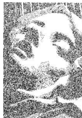
Yann Goerlinger, 2012 Série des Châteaux forts, L'extase de Sainte Thérèse, Balpen/papier, 23 x 33 cm

Met de uitzonderlijke deelname van Ms. Trip & Dr. Tease en van George , en ook met Love me harder , de officiële afterparty op zaterdag 15 september.