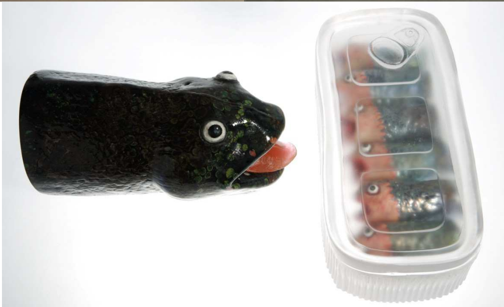
Série « Fishtre », Digérée , 2010, 45x34x57cm ; Embouteillée , 2010, 38x28x19cm ; Mad fish disease , 2009, 15x66x14cm, verre.

Mathilde Hatzenberger Gallery Hoogstraat 11 Rue Haute / 1000 BXL 00 32 (0)478 84 89 81 / www.mathildehatzenberger.eu