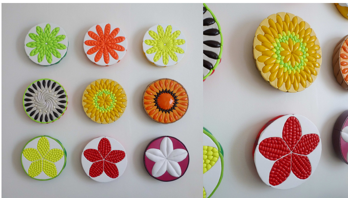
Slices , 2012 - 9 éléments, 30cm diam., textiles sur extrudé