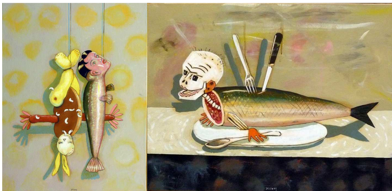
De g. à d. : Haring et Lapinos et La révolte de la sardine , techn. Mixte, 2009, chaque, 66x51.5 cm