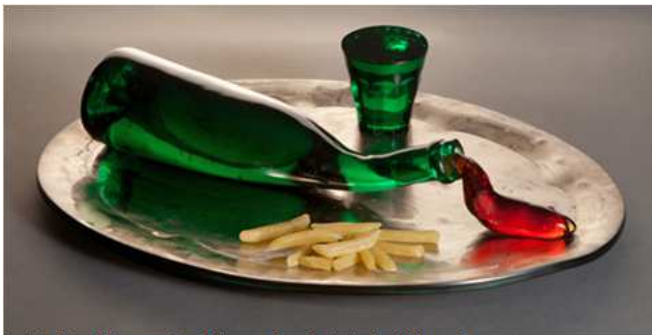
Anne-Lise Riond-Sibony, série « Fishtre », Out of the bottle , 2011, sculpture en verre

Vernissage le jeudi 29 novembre à partir de 17 heures en présence des artistes et dédicace des deux derniers ouvrages culinaires de Frédérique Jacquemin