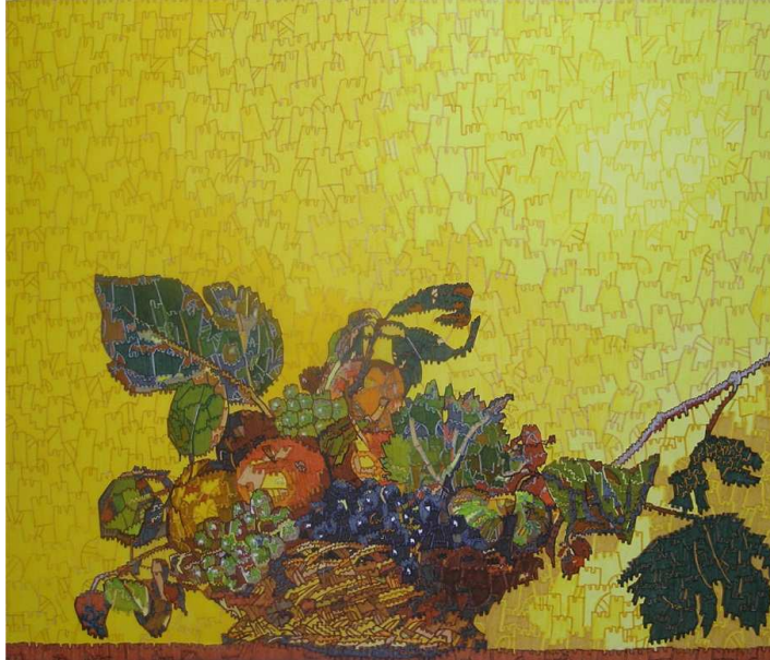
Château Caravage Corbeille de fruits , 2011, feutre/papier, 45,75x53,5 cm

Yann Goerlinger est né en 1981, à Mulhouse, en France. Il vit et travaille depuis 2007 à Bruxelles. Dans sa série des « Châteaux-forts » à laquelle il travaille depuis 2004, il a réalisé une interprétation des plus réussies d'une œuvre célèbre du Caravage.