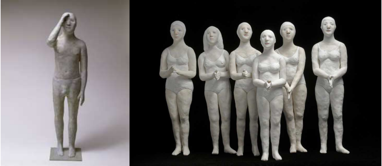
Van l. nr r.: Regarder au loin , beschilderd brons, editie van 8, h. ca 43 cm ; Groupe de nageuses , 2011-2012, hars, unieke stukken, h. ca. 40-45 cm.