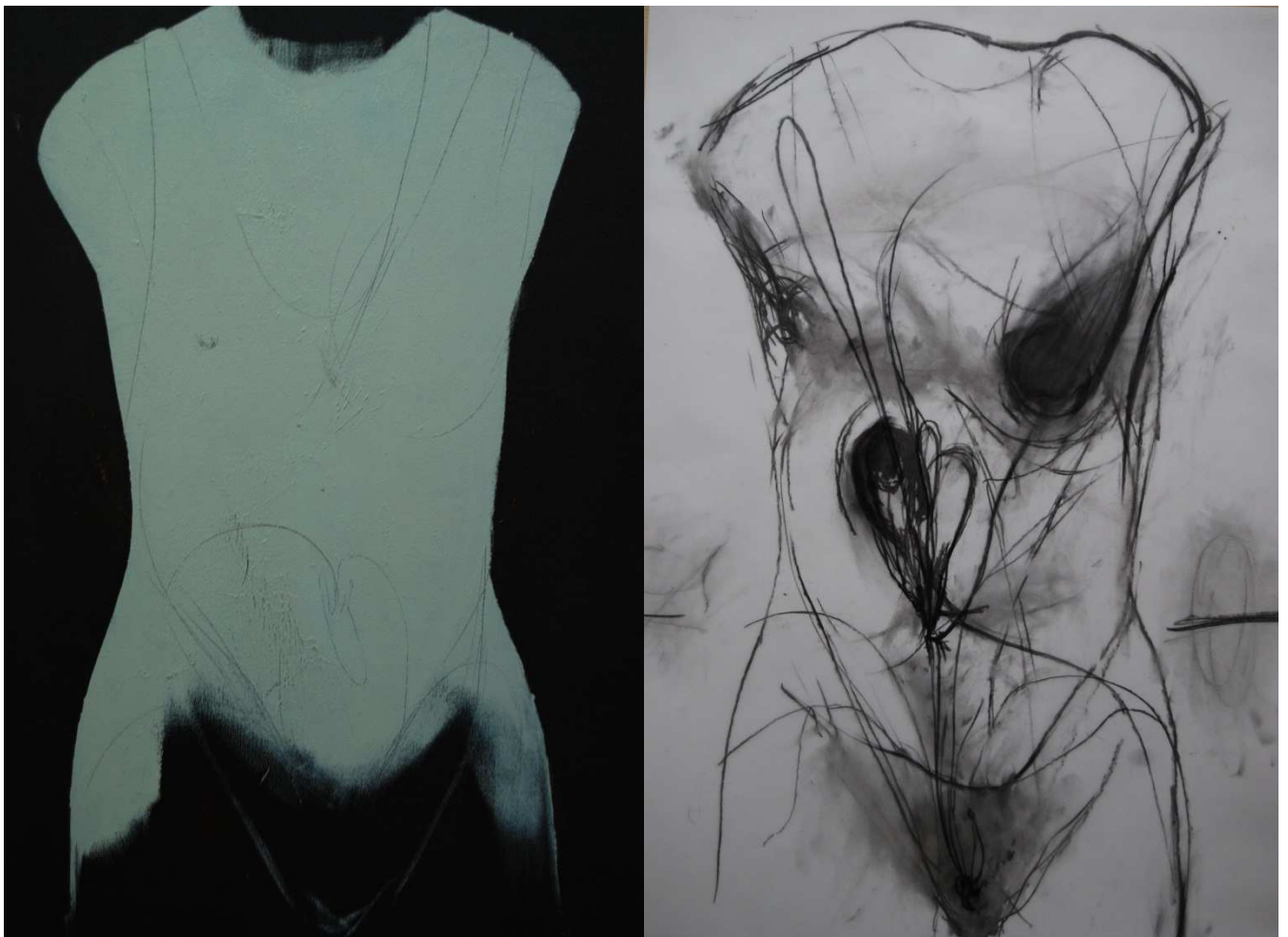
Van l. nr r.: Vénus , 2010, olie/doek, 90x70cm; Vénus , 2012, houtskool/papier, 90x70cm