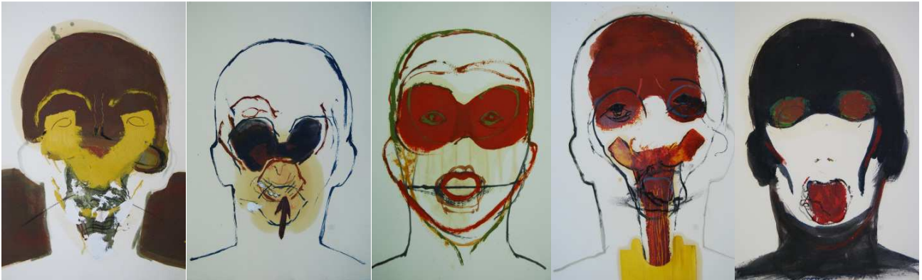
Tête , gemengde technieken/papier, 34x28cm.

Geboren in 1958, woont en werkt in Brussel. Decorontwerper en denker, stelt zijn plastisch werk tentoon sinds de jaren 80. Gewapend met zijn penseel dat weifelt tussen abstract en figuratief, ondervraagt deze een beetje autistische artiest het mensdom en zijn complexiteit doorheen verschillende picturale genres zoals bijvoorbeeld het schilderen van historische taferelen, van het naakt of het portret.