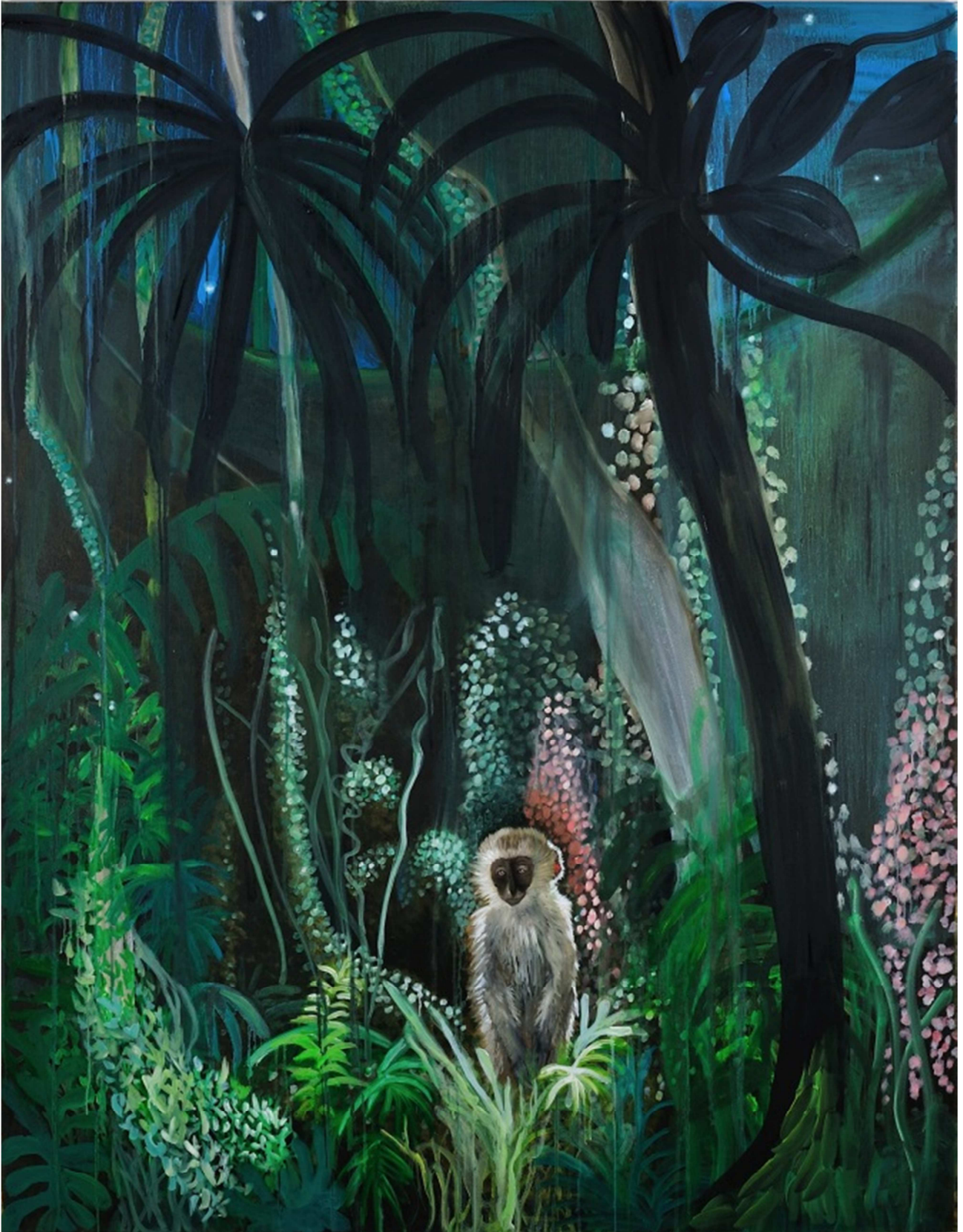
Echoes, série In the forest of the night, 2014, hst, 155x120 cm