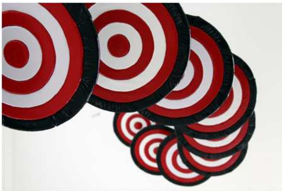
Flying Targets, 2015 (détail)