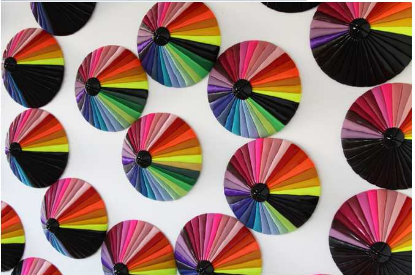
Spectrum Invaders , 2015, dimensions variables (détail et vue générale)

Mathilde Hatzenberger Rivoli Building / espace #21b à l'étage Chaussée de Waterloo, 690 (La Bascule) Entrée Rue de Praetere face au n°43 / 1180 BXL +32 (0)478 84 89 81 / www.mathildehatzenberger.eu