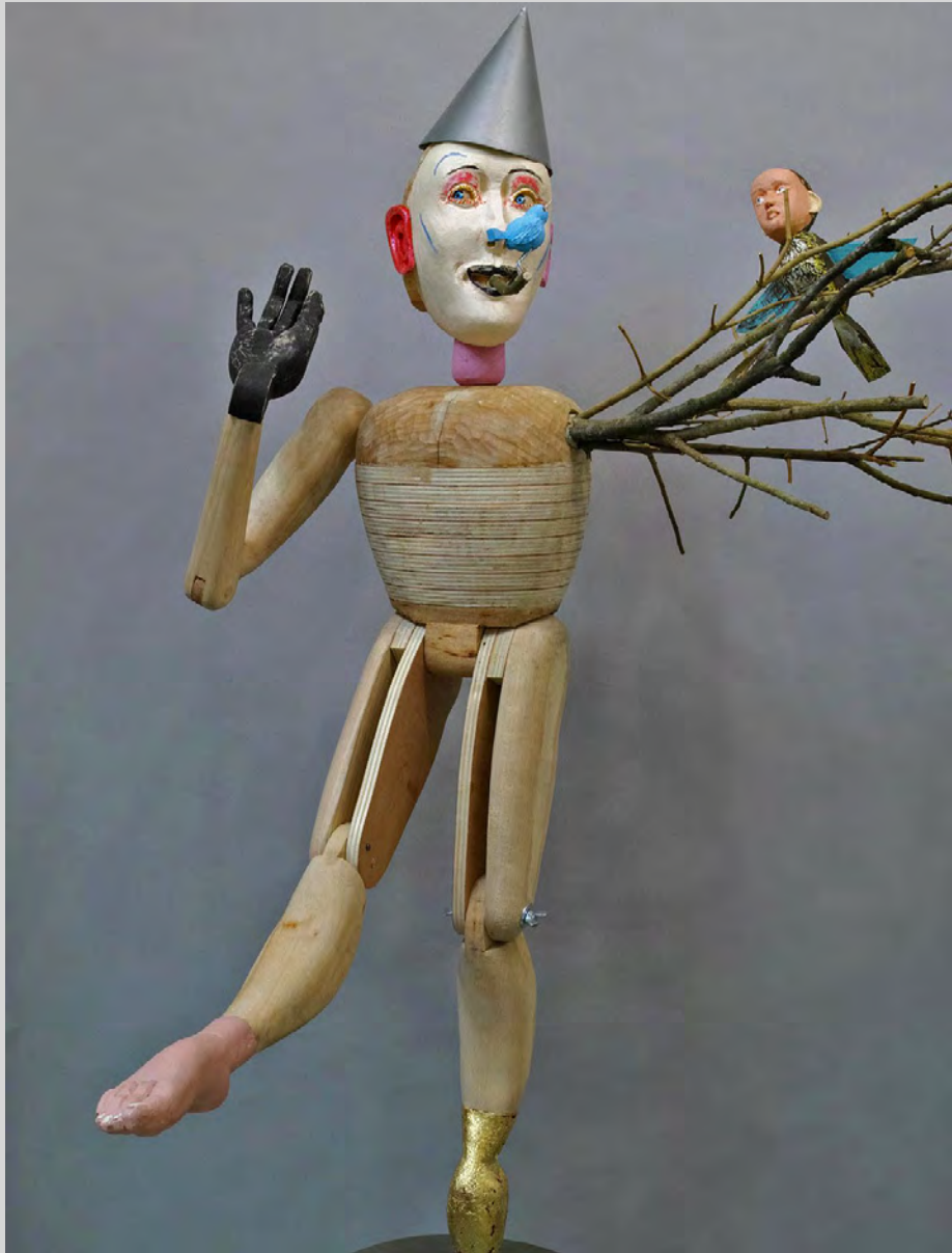
L'OISEAU BLEU, 2015

Zich ongemakkelijk voelen wanneer men naar mijn werk kijkt, is normaal, want men kijkt naar een wereld vol droombeelden vertaald in poëzie. Achter mijn personages zitten veel dingen die mekaar verbergen, zoeken en mijden. Het is een toneelstuk, een komedie, een spel en mijn inspiratiebron is de dubbelzinnigheid van hun gevoelens."