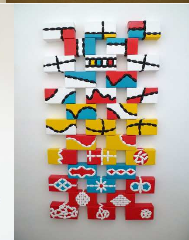
V.l.n.r., v.boven n. beneden: 36 vues (hommage à Hokusai) , 2012, ca 138x280cm ; Les Petits soldats , 2013, ca 20x60cm diam. ; La Route de la Soie , 2010, 119cm diam. ; La Nouvelle Route de la Soie , 2011, ca 180x60cm ; The Wall , 2012, 143x82x6cm.