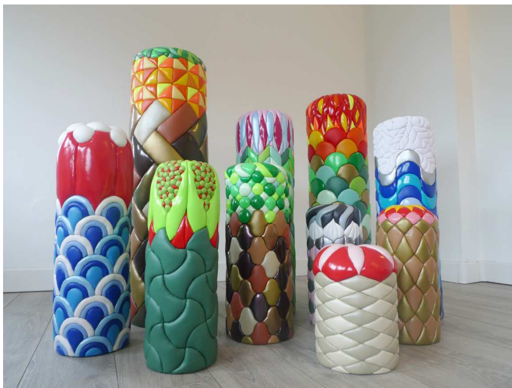
Champions' League , 2012-2013, verschillende afmetingen, diverse stoffen op geëxtrudeerd polystyreen

CYCLO is tenslotte een knipoog naar Vietnam, deze van de cyclo's, de mythische transporteurs die bezig zijn te verdwijnen. Het Vietnam waarvan de discrete en aanhoudende invloed zich laat voelen in de vormen die de Frans-Vietnamese kunstenaar gebruikt, meer bepaald in de "lingam", een duidelijk opgerichte fallus afkomstig uit het hindoeïsme, wat men bijvoorbeeld terugvindt in de reeks Champions' League ; het Vietnam dat een onuitgegeven plastische zoektocht voedt waarin het hybride en het organische een centrale plaats innemen.