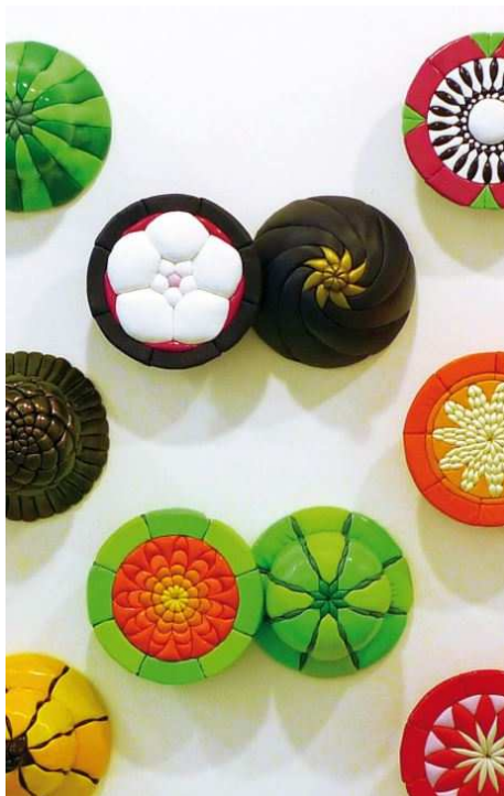
Trophées, 2013-2014, détail.