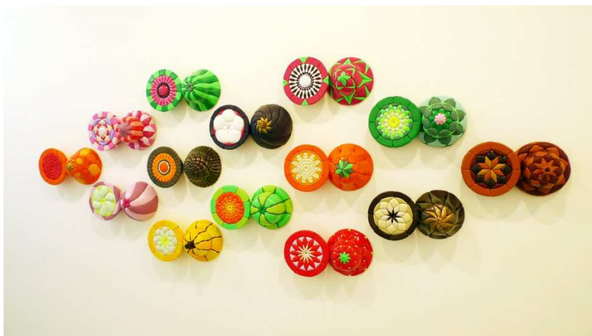
V.l.n.r. : Slices , 2012, 9 elementen met 30cm diam., textiel op geëxtrudeerd polystyreen; Trophées , 2013, 14 dyptiques, ieder ca 22x40x16 cm, textiel op geëxtrudeerd polystyreen.

CYCLO is tenslotte een knipoog naar Vietnam, deze van de cyclo's, de mythische transporteurs die bezig zijn te verdwijnen. Het Vietnam waarvan de discrete en aanhoudende invloed zich laat voelen in de vormen die de Frans-Vietnamese kunstenaar gebruikt, meer bepaald in de "lingam", een duidelijk opgerichte fallus afkomstig uit het hindoeïsme, wat men bijvoorbeeld terugvindt in de reeks Champions' League ; het Vietnam dat een onuitgegeven plastische zoektocht voedt waarin het hybride en het organische een centrale plaats innemen.