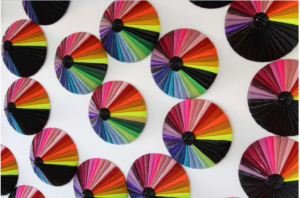
Spectrum Invaders , 2015, variabele afmetingen (detail en algemeen zicht)

Mathilde Hatzenberger Rivoli Building / ruimte #21b/1ste verd. Waterloose Steenweg 690 (La Bascule) Ingang de Praeterestraat tegenover nr.43 / 1180 BXL +32 (0)478 84 89 81 / www.mathildehatzenberger.eu