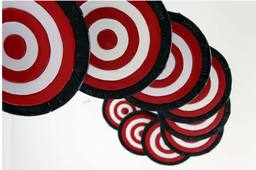
Flying Targets, 2015 (detail)