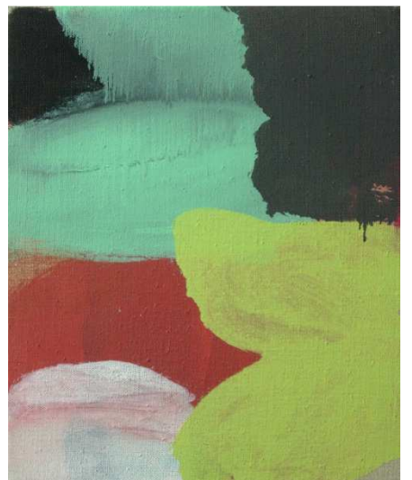
De g. à d. : Untitled , 2013, chaque huile sur toile et 30,5x20,5 cm