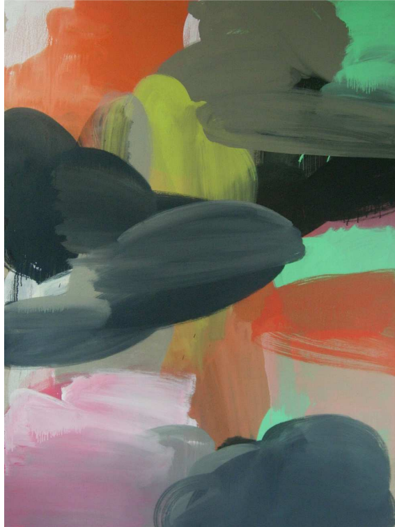
Turbulence , 2013, hst, 152,5x114,5cm