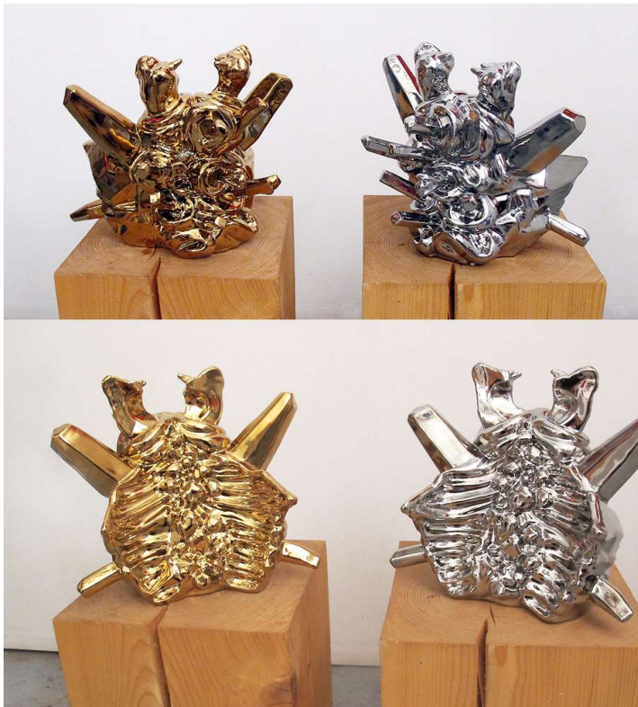
Chrome cats , 2013, porcelaine de chine métallisée réalisées en résidence à J, chaque 30x30x30 cm

Mathilde Hatzenberger Gallery Rue Washington, 145 / 1050 BXL +32 (0)478 84 89 81 / www.mathildehatzenberger.eu