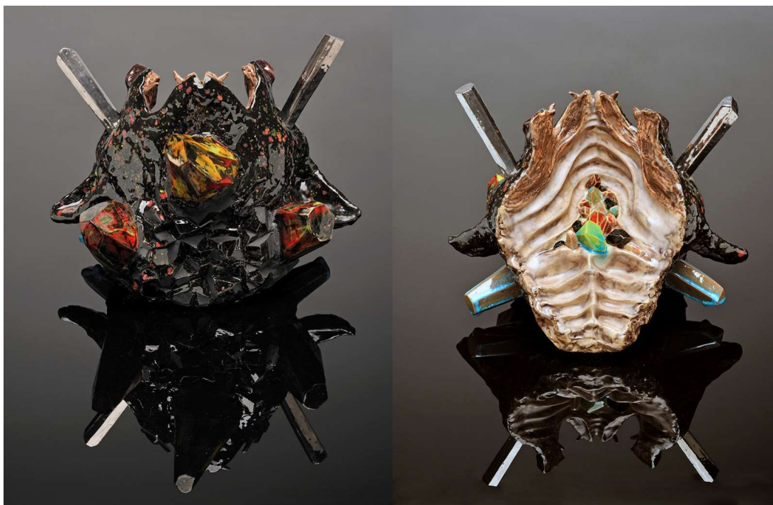
Roxanne Jackson, I've been known to ride on chrome , 2013 Céramique, 30,5x35,6x30,5 cm