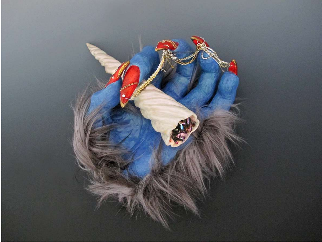
Roxanne JACKSON, Legends , 2015, techniques mixtes, 35,6x30,5x17,8cm