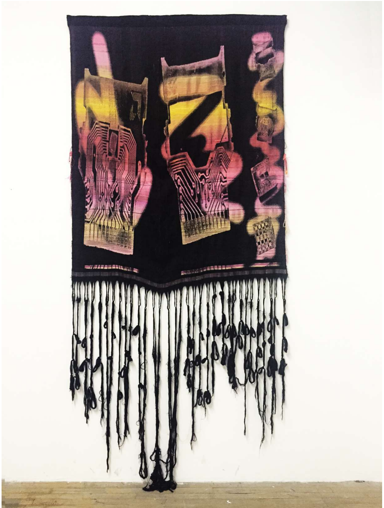
Atari twin , 2016 jacquard à la main, 280 (variable selon les franges) x 147 cm

Mathilde Hatzenberger Gallery Rue Washington, 145 / 1050 BXL +32 (0)478 84 89 81 / www.mathildehatzenberger.eu