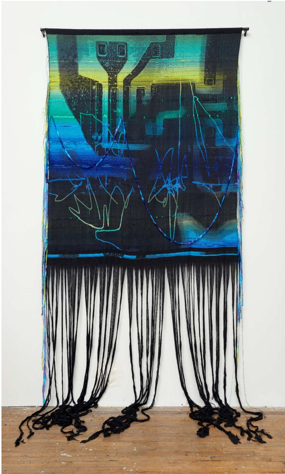
Robin Kang, Isla Tortugua , 2016 jacquard à la main, environ 233 (variable selon les franges)x133 cm

Mathilde Hatzenberger Gallery Rue Washington, 145 / 1050 BXL +32 (0)478 84 89 81 / www.mathildehatzenberger.eu