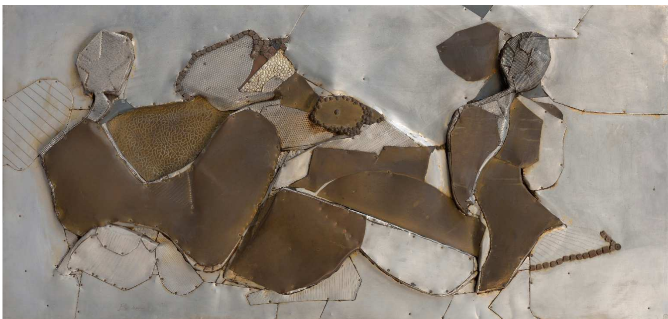
PB, Derrière la Colline , années 60, métaux sur bois, 65x140,5 cm

Mathilde Hatzenberger 145 rue Washington 1050 BXL / Belgium