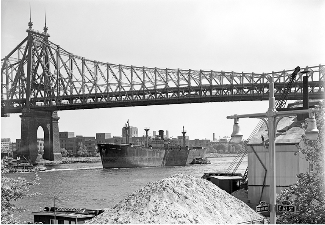
Cuchi White, Boat over the bridge