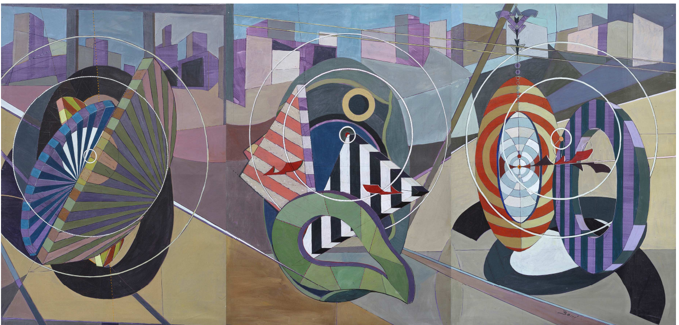
PB, La Città , triptyque, 1980, acrylique sur toile, 3x 162x114 cm

Mathilde Hatzenberger 145 rue Washington 1050 BXL / Belgium