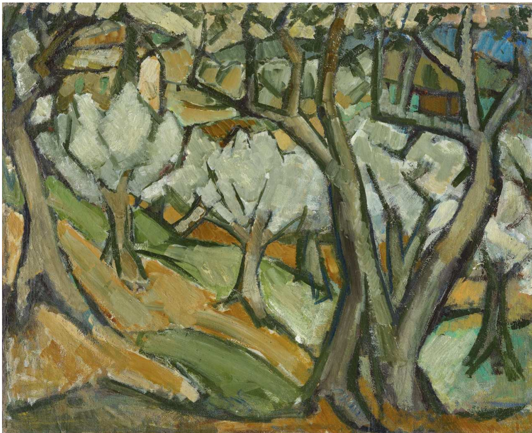
PB, Dit Olivi nel Mugello , 1950-53, hst, 66x80,5cm