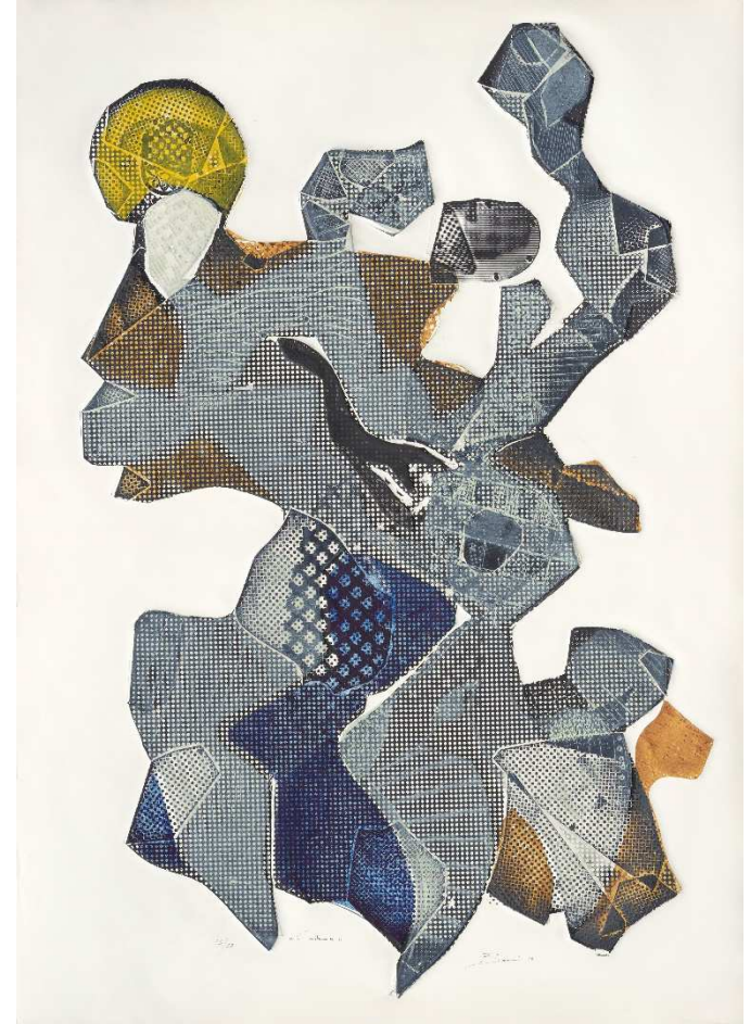
À gauche : Sans titre , 1969, inox sur âme de bois, 65x50x45 cm - photos JL Losi À droite : Cadence , 1969, graphisculpture, 105x75 cm inv. en cours - photos JL Losi