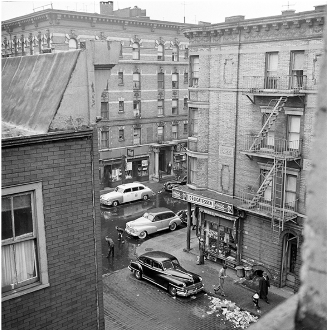
Cuchi White, Street game