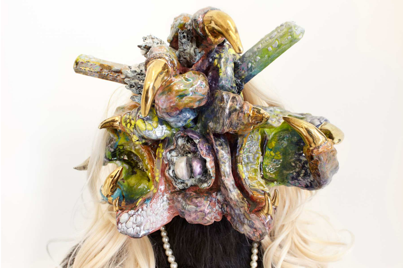
Un détail de la pièce Roxanne Jackson

Mathilde Hatzenberger Gallery Washingtonstraat, 145, rue Washington 1050 Brussels / Belgium