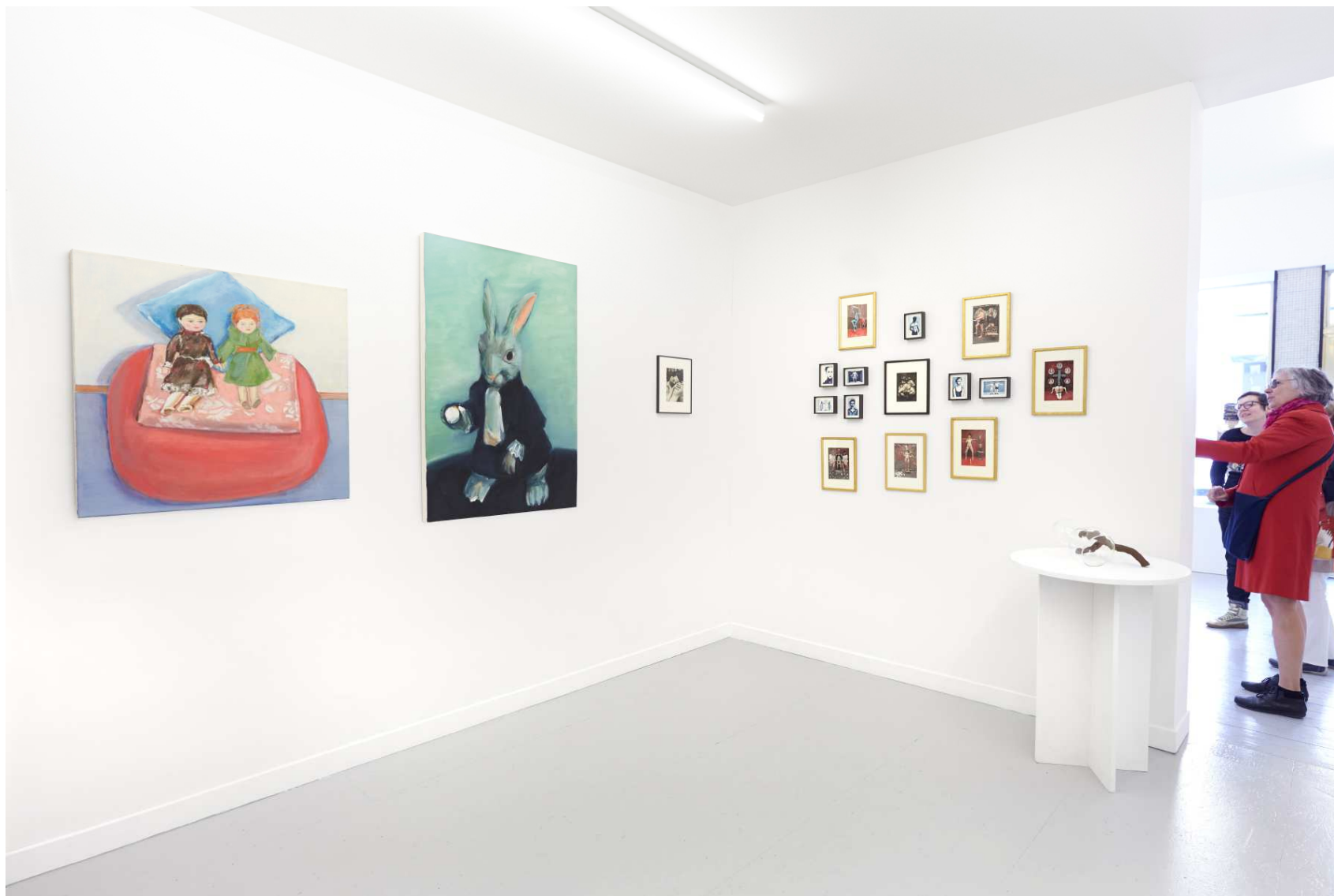
A droite : « Puppet and her psychtherapist » et « Timeless » d'Eszter Deli KINGA ; un collage de Renaud de Putter, puis un ensemble composé d'oeuvres d'Alan TEX, de Renaud de Putter et de Pierre Molinier.

Mathilde Hatzenberger Gallery Washingtonstraat, 145, rue Washington 1050 Brussels / Belgium