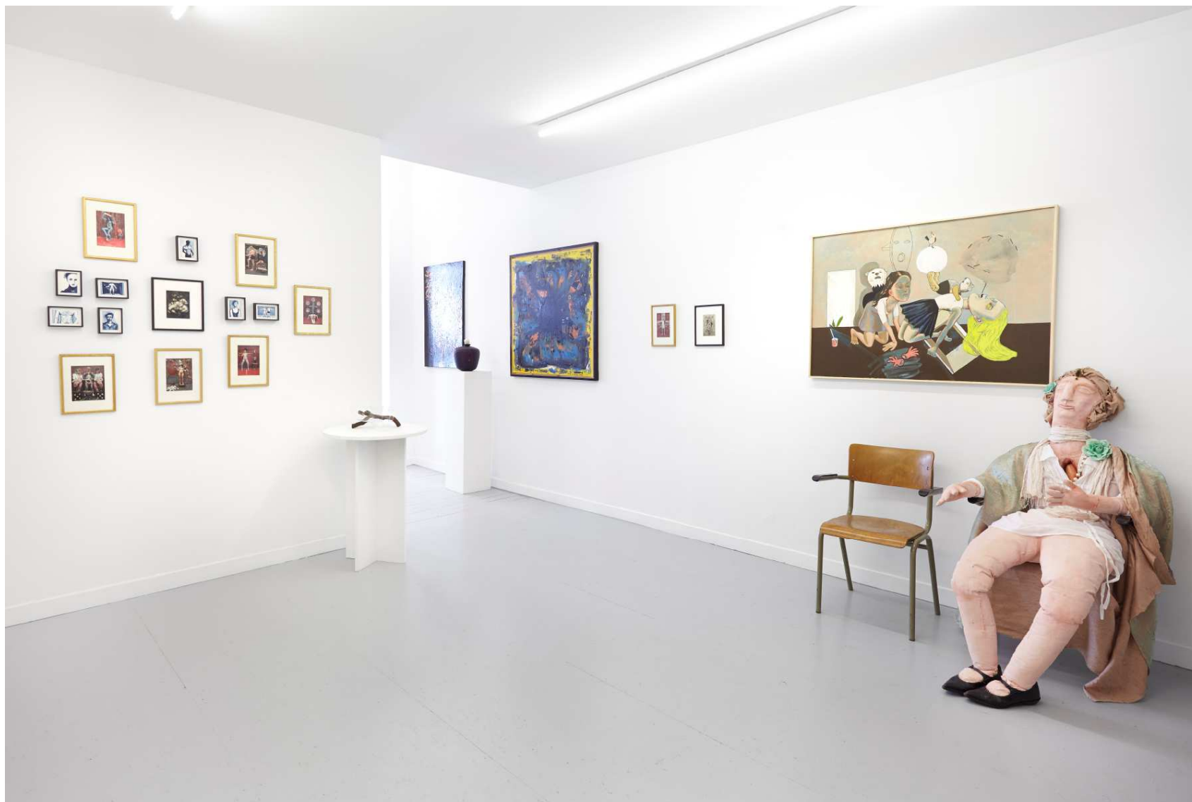
Vue d'ensemble de la salle arrière

Mathilde Hatzenberger Gallery Washingtonstraat, 145, rue Washington 1050 Brussels / Belgium