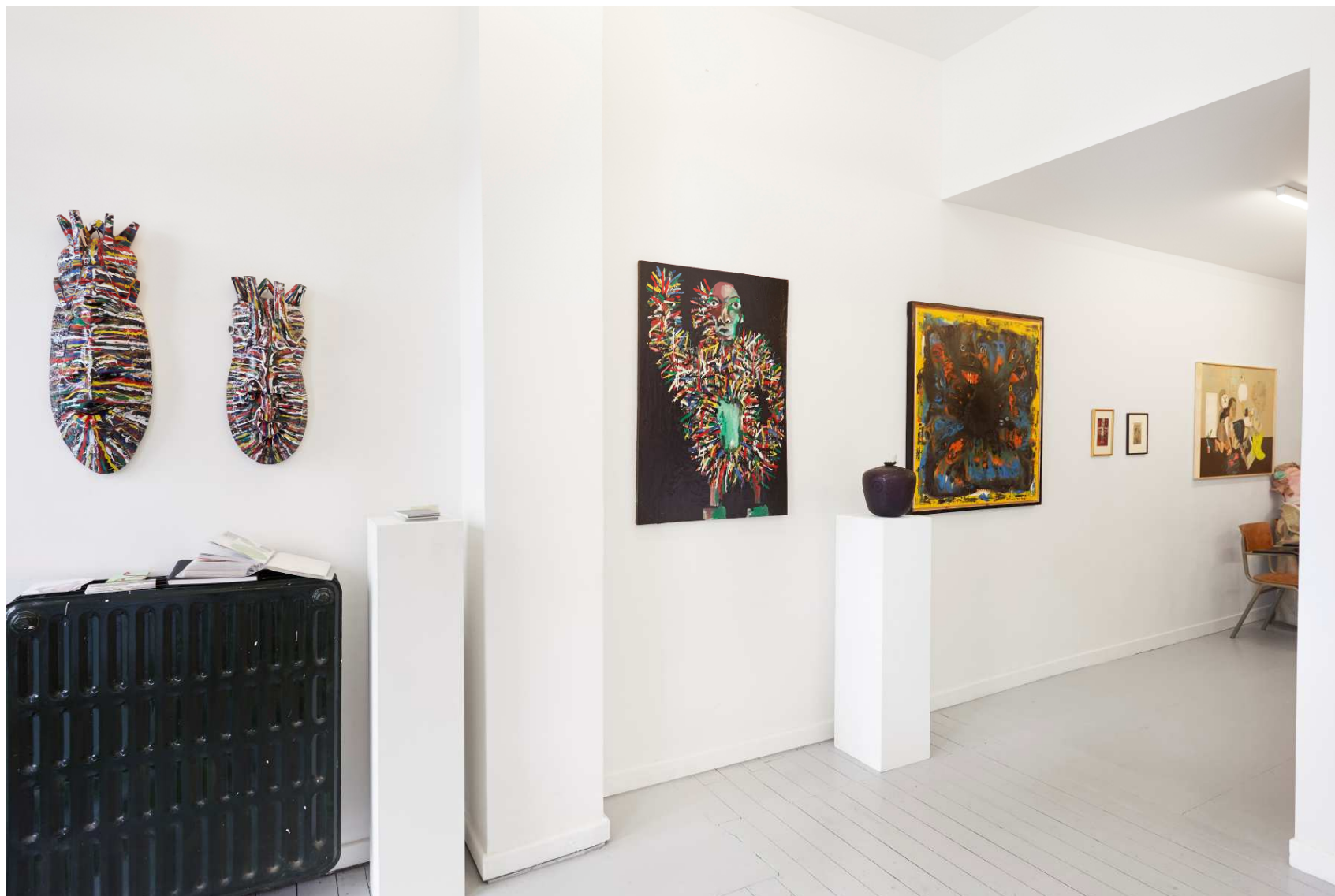
Vue d'ensemble du mur gauche.

Mathilde Hatzenberger Gallery Washingtonstraat, 145, rue Washington 1050 Brussels / Belgium