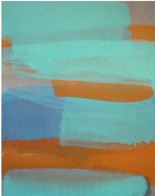
Pale green , 2017 huile sur lin, 76,2x60,96cm,