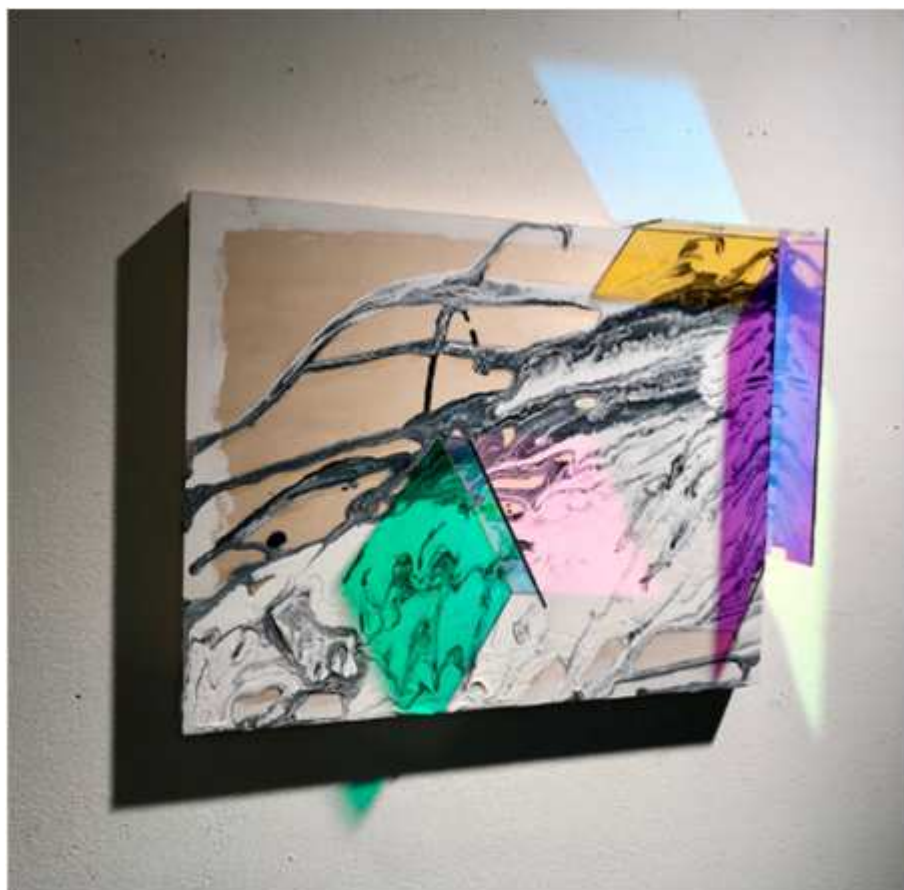
Sundial #2 , 2018

Acrylique sur toile, bois et verre dichroïque, 24" w x 24" h x 6" d