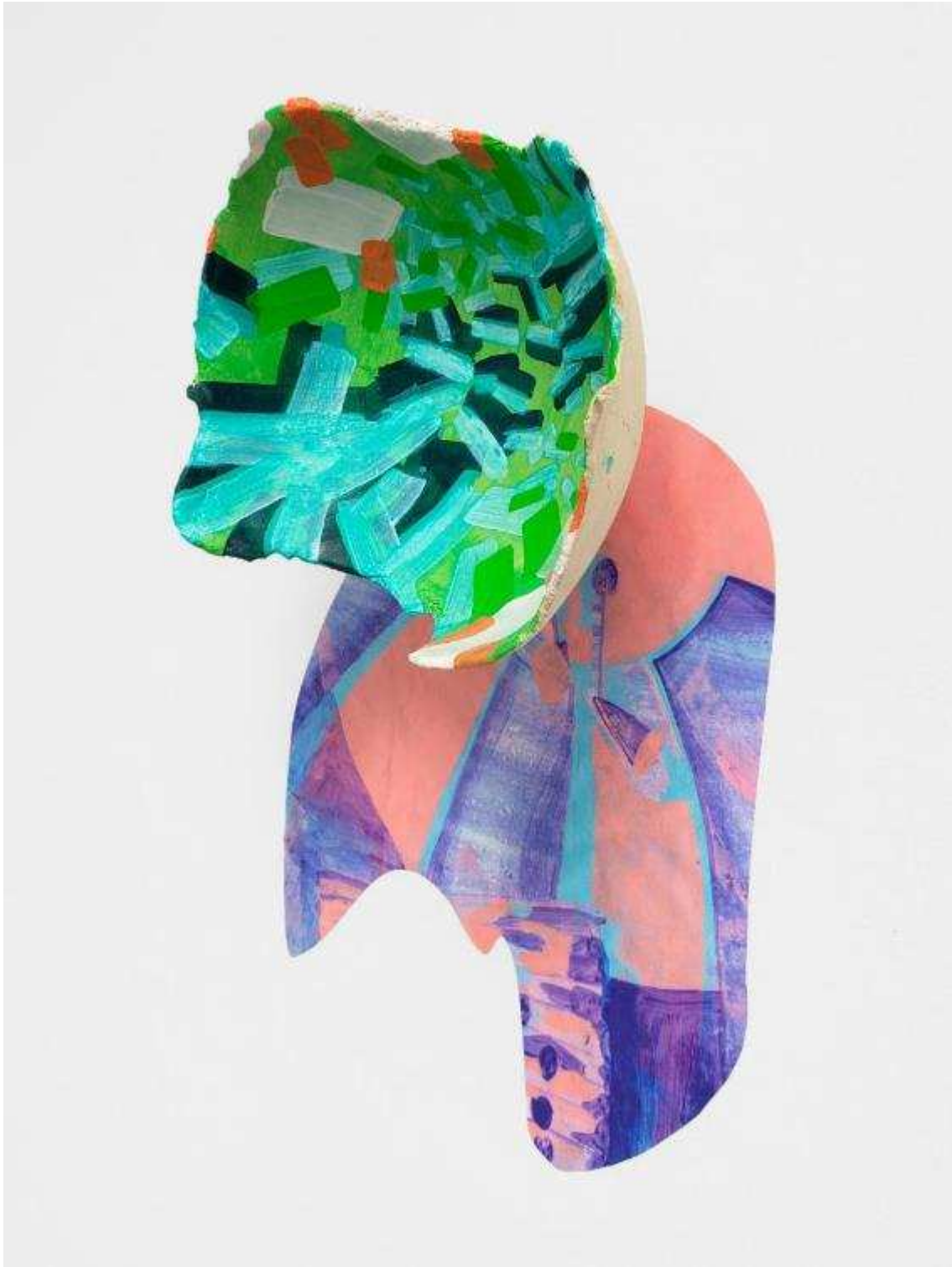
Stadttempel, Wien-LVHN, The Philip and Muriel Berman Sculpture Park, ii 2018 Acrylique sur céramique et vinyl adhésif imprimé, 50.8x71.12x20.32 cm