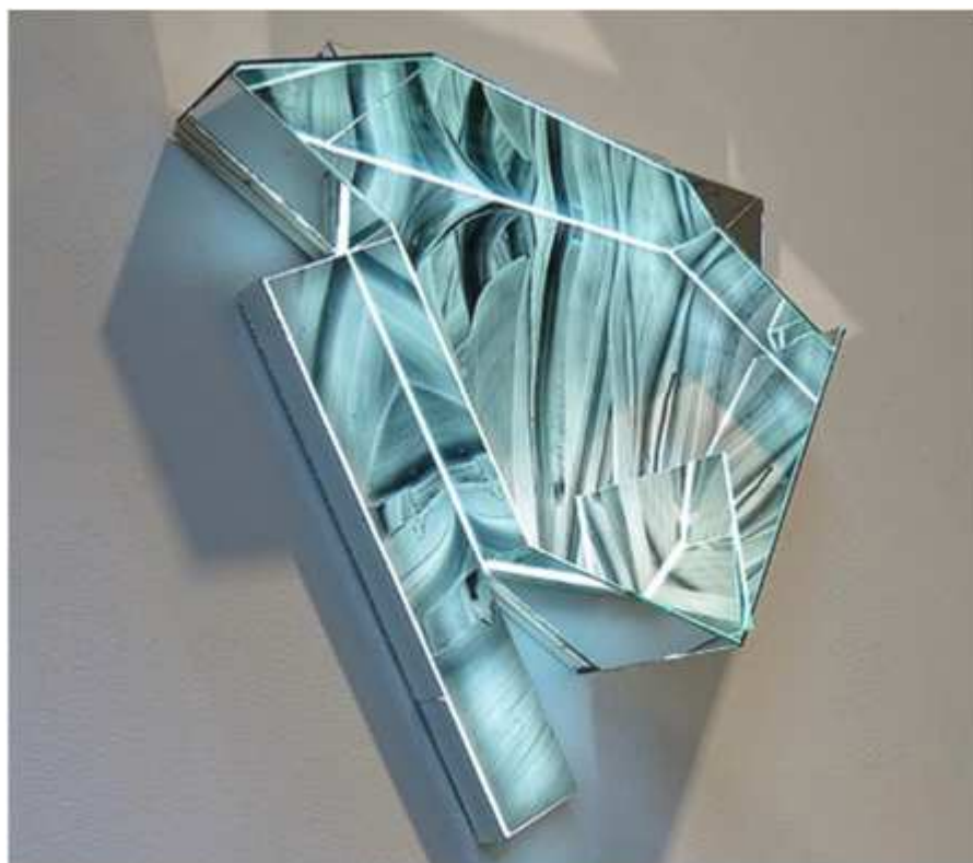
Kaleidoscope 800 , 2016

Acrylique sur toile, bois et verre dichroïque, 24" w x 24" h x 6" d