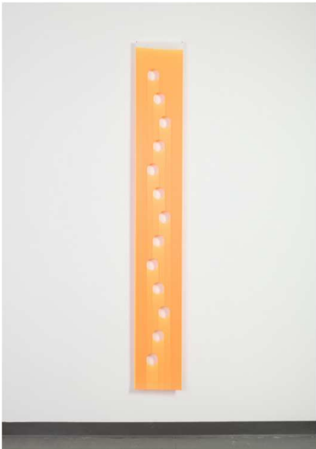
Skinny dip 3 , 2016 acrylique sur mylar, 223,5x30,5cm

Mathilde Hatzenberger 145 rue Washington 1050 BXL / Belgium +32 (0)478 84 89 81 / www.mathildehatzenberger.eu