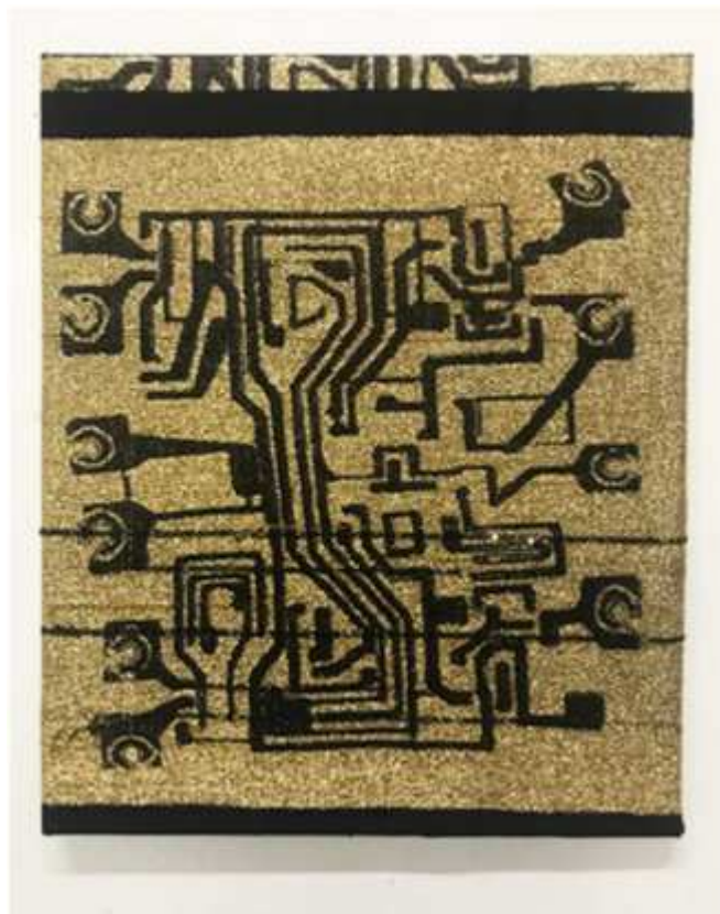
Titres en cours , 2018 Jacquard tendu sur chassis, tailles variables

Mathilde Hatzenberger 145 rue Washington 1050 BXL / Belgium +32 (0)478 84 89 81 / www.mathildehatzenberger.eu