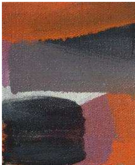
Solid , 2017 huile sr lin, 30,5x20,5cm

Curriculum vitae complet de chacun des artistes est disponible sur demande.