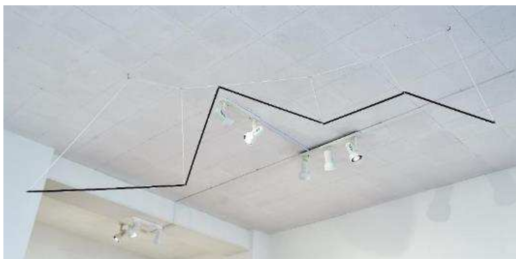
Bridging the Distance, 2017 Corde, tube PVC et éléments métalliques, 120 x 230 x 100 cm.

Mathilde Hatzenberger 145 rue Washington 1050 BXL / Belgium +32 (0)478 84 89 81 / www.mathildehatzenberger.eu