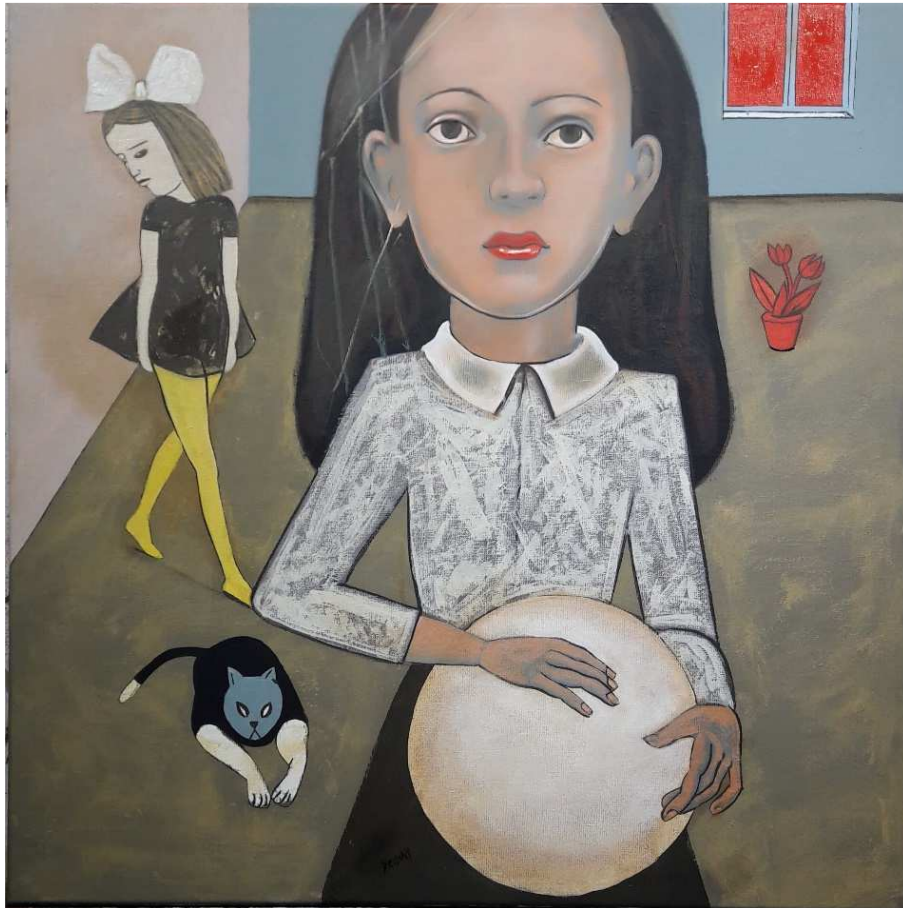
Jour rouge , 2021, 96x96 cm