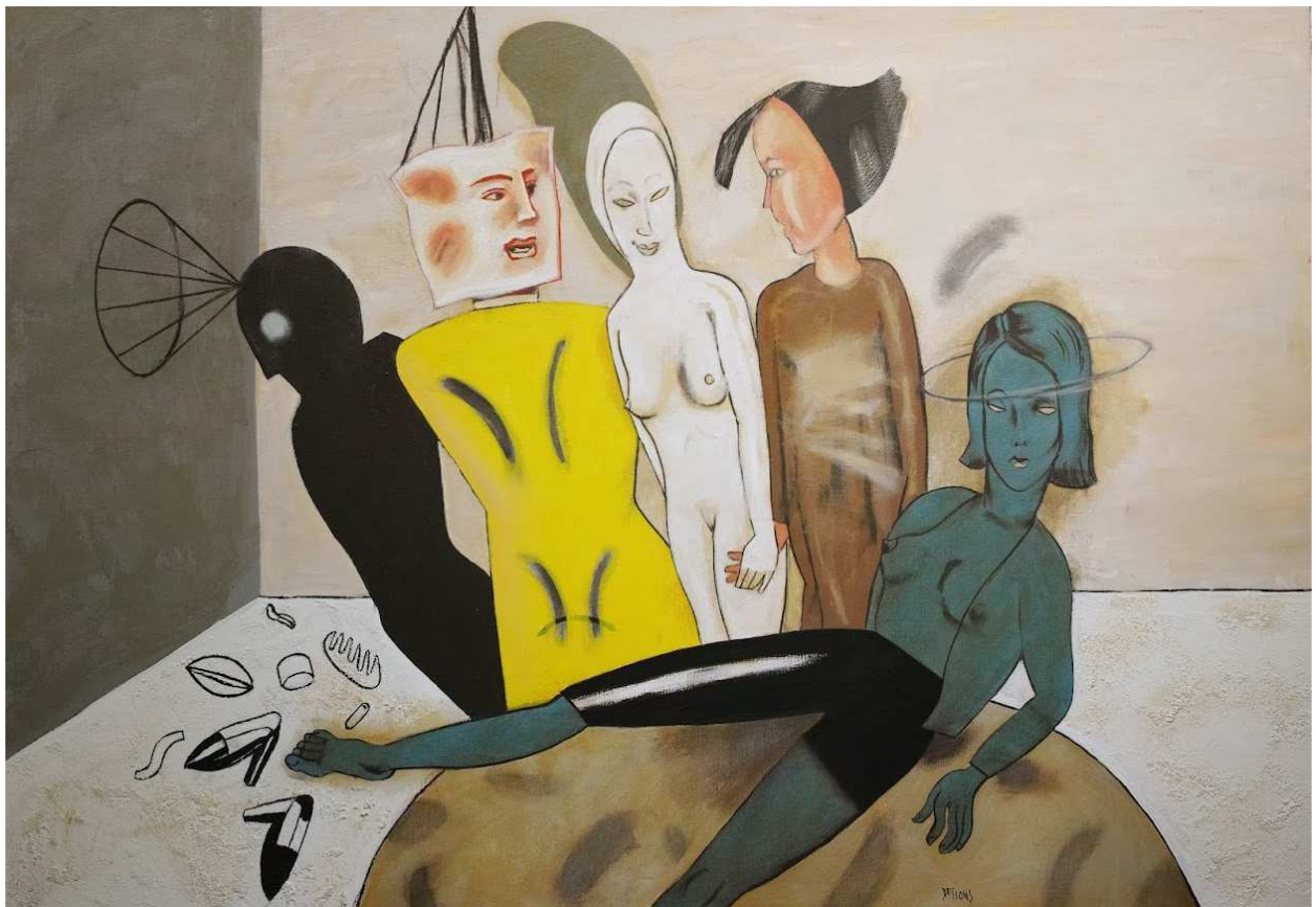
Un quart d'heure avant , 2021, 81x116 cm