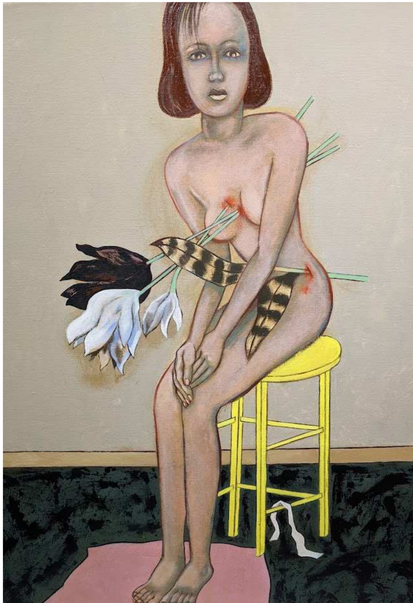
En plein cœur , 2021, tech. mixtes sur toile, 92x65 cm

Pierre Dessons, 85 printemps et demi aujourd'hui, développe, en sculpture – et nous aurons l'immense honneur de présenter ici la toute dernière sculpture de Pierre, rare depuis qu'il est devenu allergique à la poussière du bois qu'il employait, comme en peinture ou en dessin, une figuration nourrie d'illu, de pop, de Primitifs Italiens, et de pêche à la mouche. Décroché par sa singularité modeste, sa tendance autarcique ?; du mouvement dit de la figuration narrative, à côté des Arroyo, Fromanger, Cueco, Rancillac, ou Adami pour ne citer que les plus connus, Dessons n'est rien de moins pour moi que le Hockney français. La confidentialité seule les sépare, et il ne vous reste qu'à le vérifier si vous n'êtes pas un habitué de la galerie