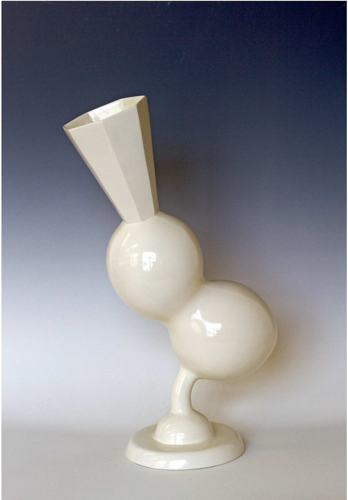
Taking a stand , 2021, fibre de verre, 57x32x18cm

Mathilde Hatzenberger Gallery Rue Washington, 145 / 1050 BXL www.mathildehatzenberger.eu