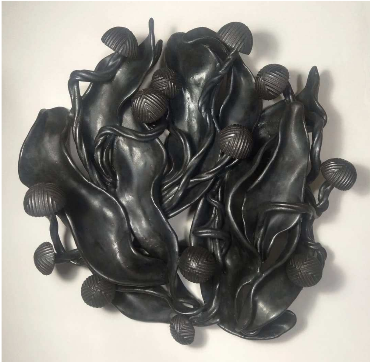
Invasive species , 2022, ca 50 cm de diam, grès émaux métalliques

Né en 1971 au Portugal ; vit et travaille depuis 2015 à Bruxelles. Peintre et céramiste d'une technicité sans faille. Nous aurons la joie de découvrir dans ces deux matières des pièces récentes et inédites d'envergure.