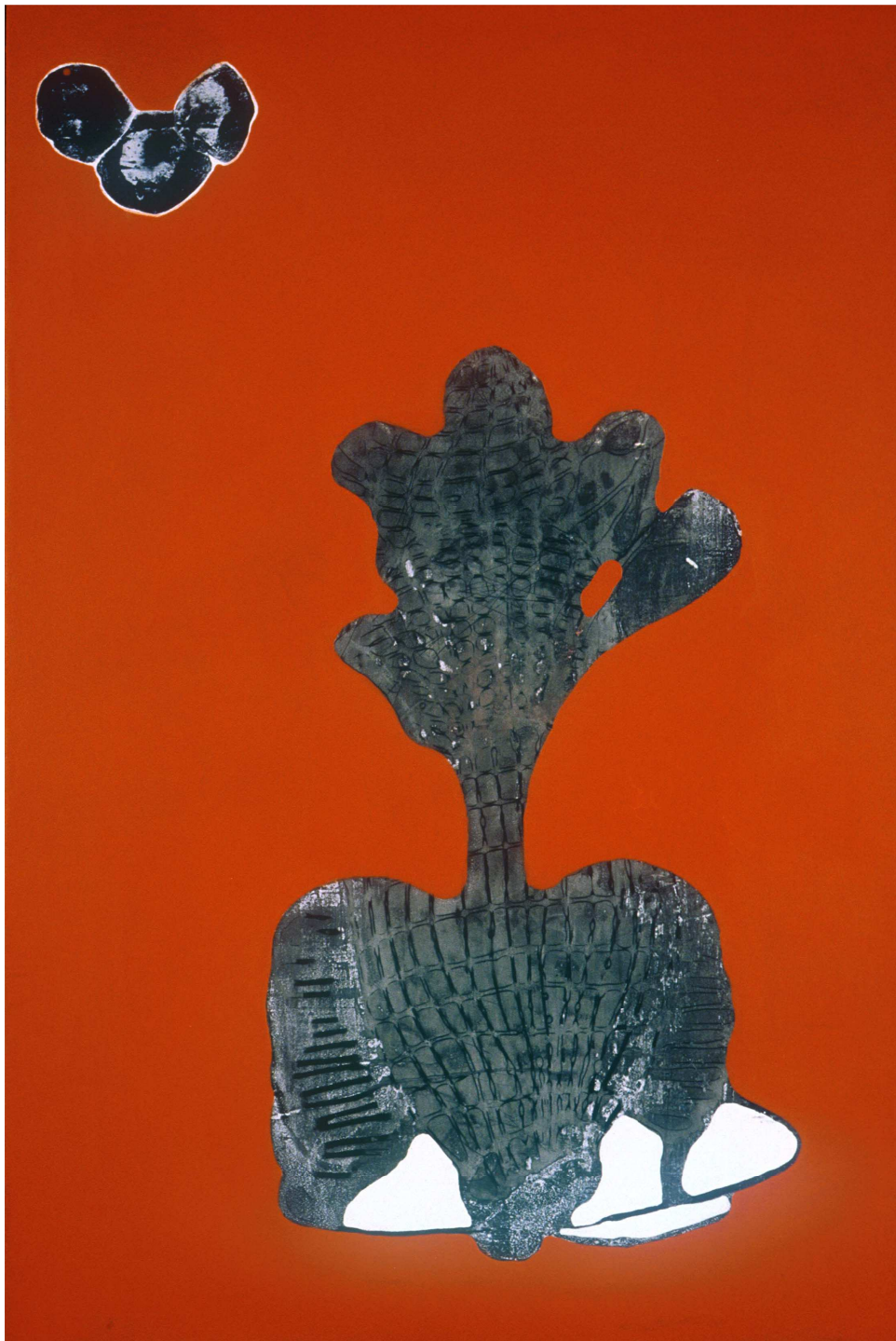
P 146, 2003, techniques mixtes sur bois, 120cmx80cm

Né en 1961 à Bruxelles. Après 25 ans passés à l'étranger, cet ancien illustrateur passé à la peinture, au dessin, à la photographie mais aussi à la sculpture, a reposé ses valises à Bruxelles. Nous présenterons un échantillon récent de ses quatre matières qu'il alimente de concert.