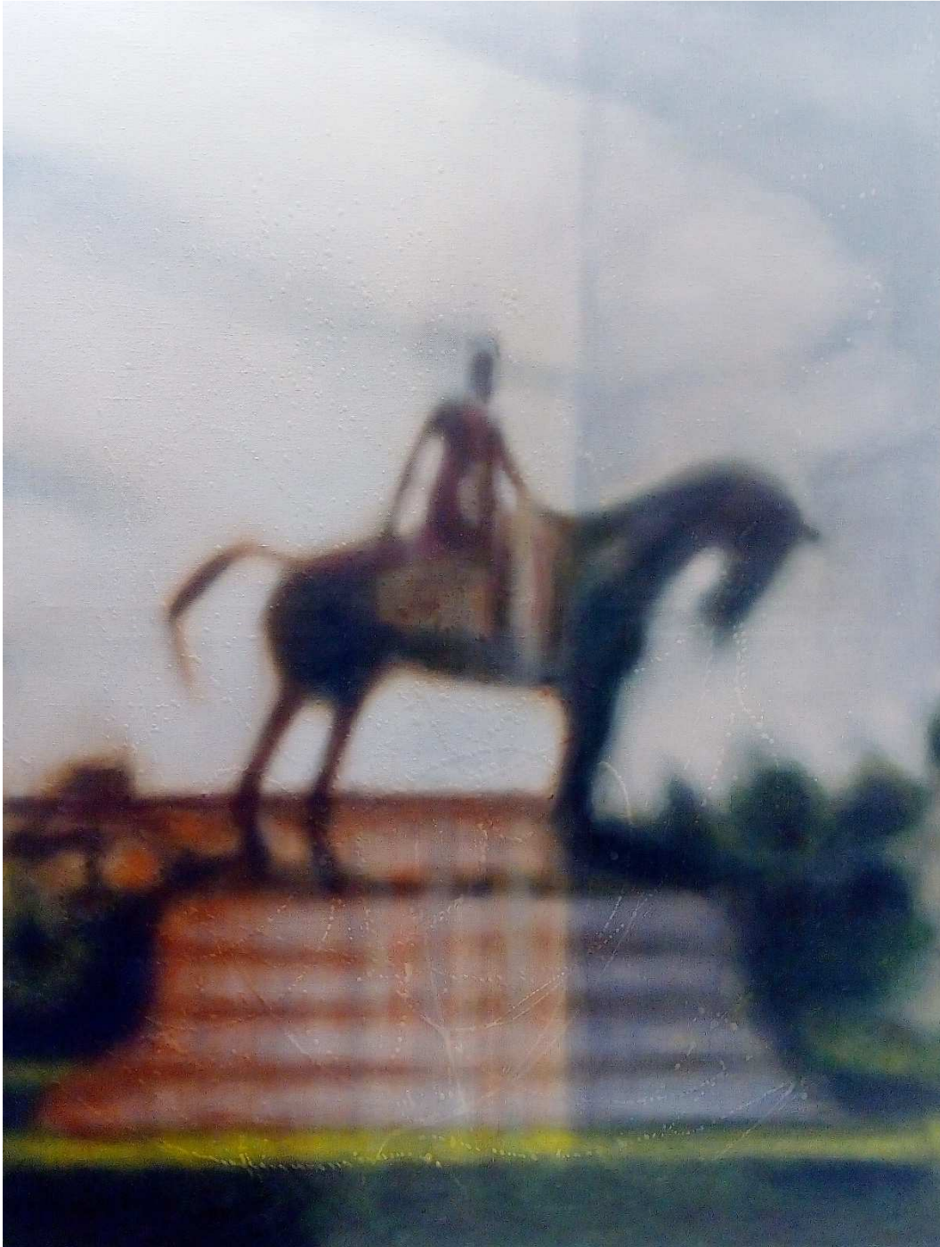
Léopold , 2021, acrylique sur toile, 160x120 cm

Née en 1965 à Toulouse, vit et travaille depuis 2000 à Bruxelles. IA se partage entre le bijou contemporain, la sculpture et la peinture qui bénéficient de sa grande attention pour les matières, et toutes leurs spécificités. Nous aurons le plaisir de montrer à Paris de très grands formats anciens, comme récents et inédits.