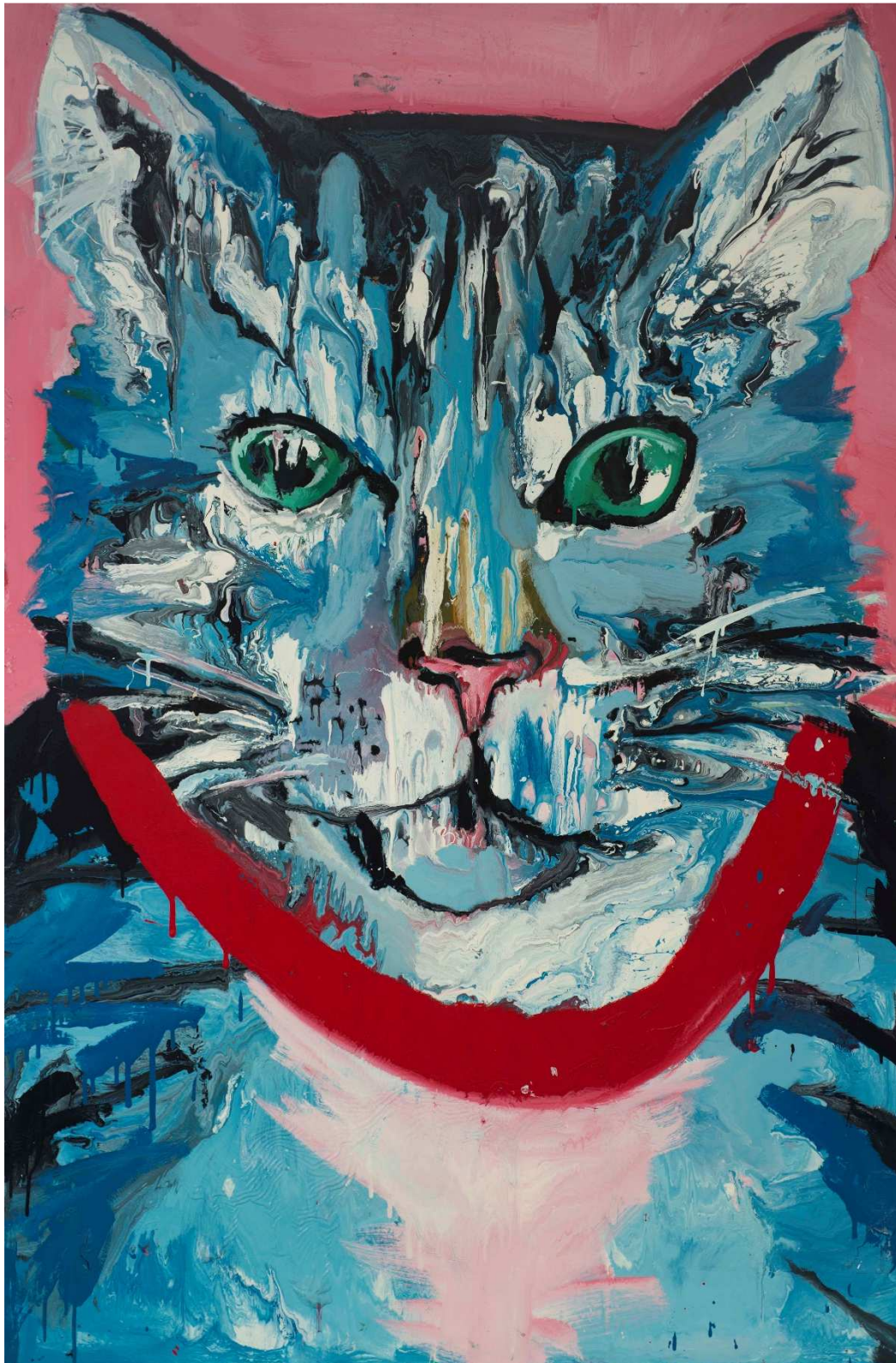
Chat, 2009, laque sur toile, 165x110 cm

Née à Angers en 1985 ; vit et travaille depuis 2009 à Bruxelles. Née peintre, elle convertit tout à sa seule religion : la peinture.