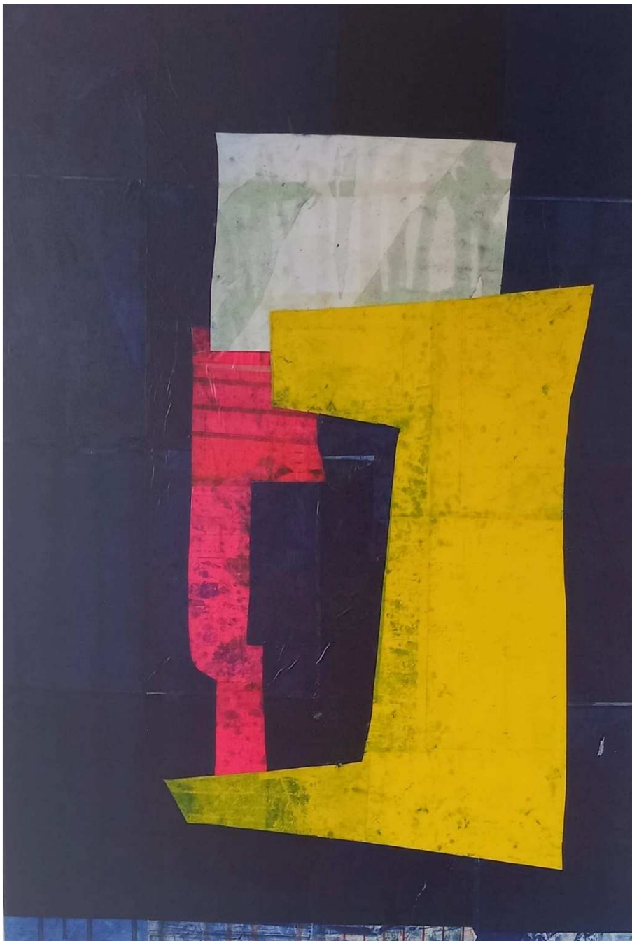
Sans titre , 2022, techniques mixtes sur toile, 120x95 cm

Né en 1985 en France. Vit et travaille à Bruxelles depuis 2009. S'illustrant dans le domaine du dessin déjà depuis une décennie, VC est à l'heure actuelle entrain de dessiner un chemin tout aussi pictural. C'est cette inflexion que nous présenterons à Paris.