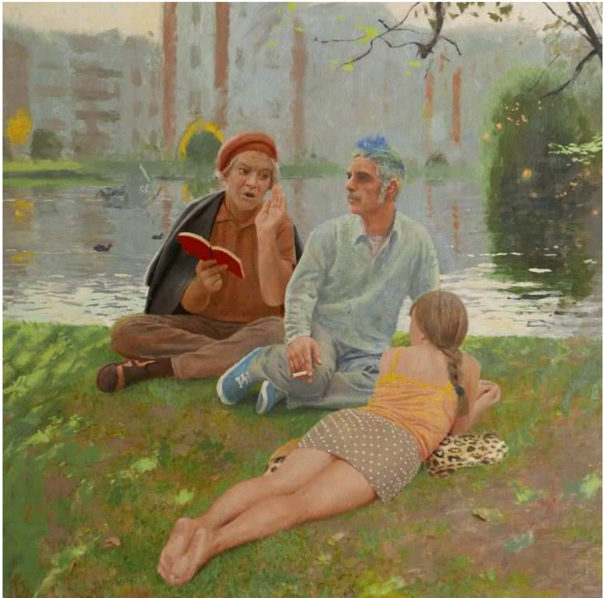
La drague , 2022, 110x110 cm

Né en 1968 en Espagne ; il vit et travaille entre Madrid et Bruxelles depuis 2011. Merveilleux technicien de la peinture, MO n'est rien de moins qu'un maître contemporain.