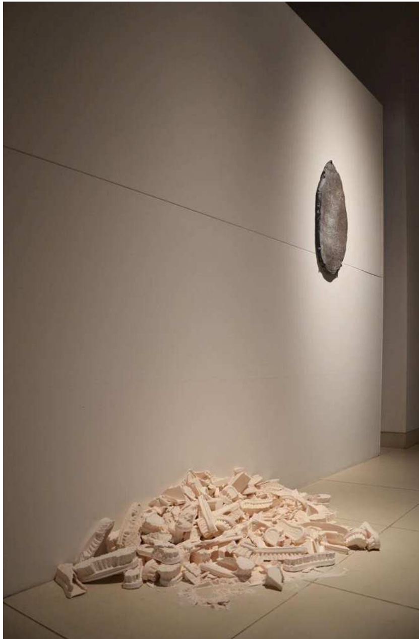
Jeannette , 2015, Installation vidéo et sonore, dégoré de porcelaine, grés, Dim. Var.

Née en 1985 à Antibes. Scénographe et artiste polyvalente développant un tropisme pour la céramique dont elle a conquis la maîtrise à La Cambre. Nous présenterons une sélection de pièces nées à Bruxelles et présentées, tantôt à la Triennale du Verre et de la Céramique de Mons, tantôt à l'occasion de sa première exposition personnelle en 2017 à la galerie. (Ses pièces nouvelles, exposées actuellement à L'École de Céramique de Vallauris pour tout l'été, seront montrées chez moi en janvier 2023).