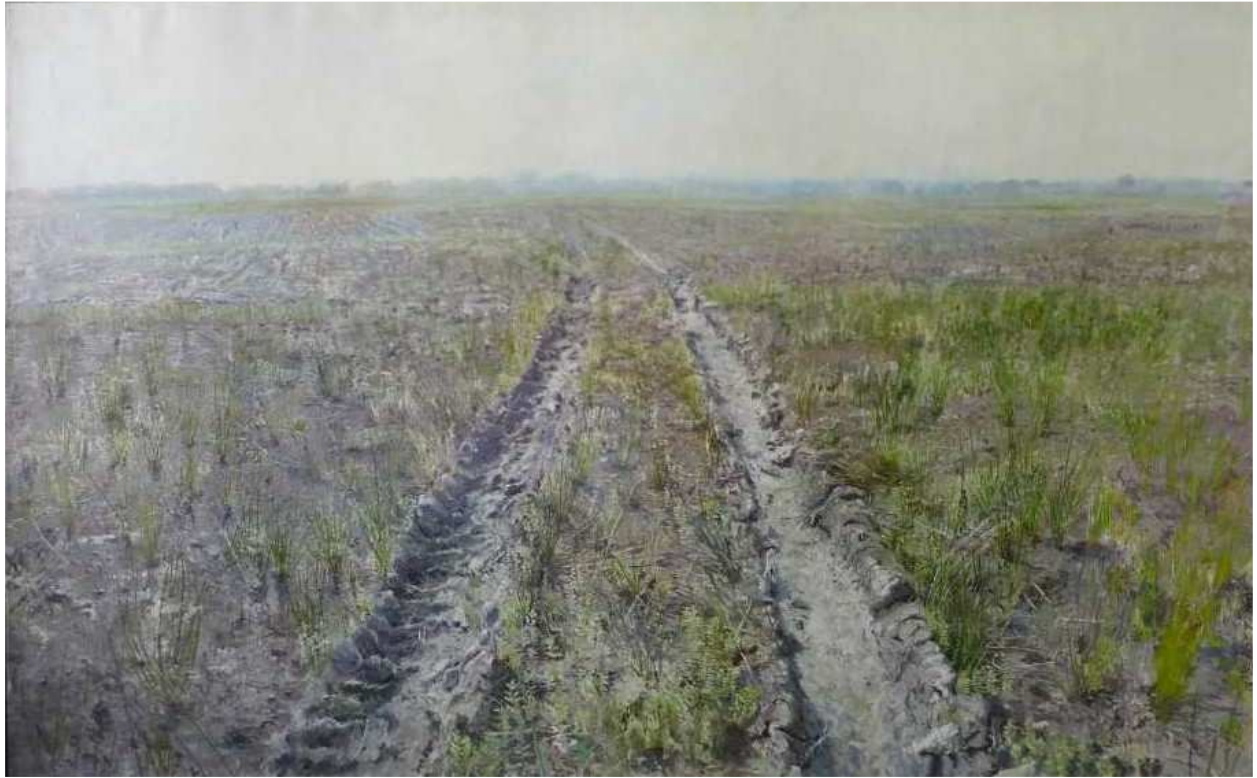
Bangla , hst, 144x227 cm