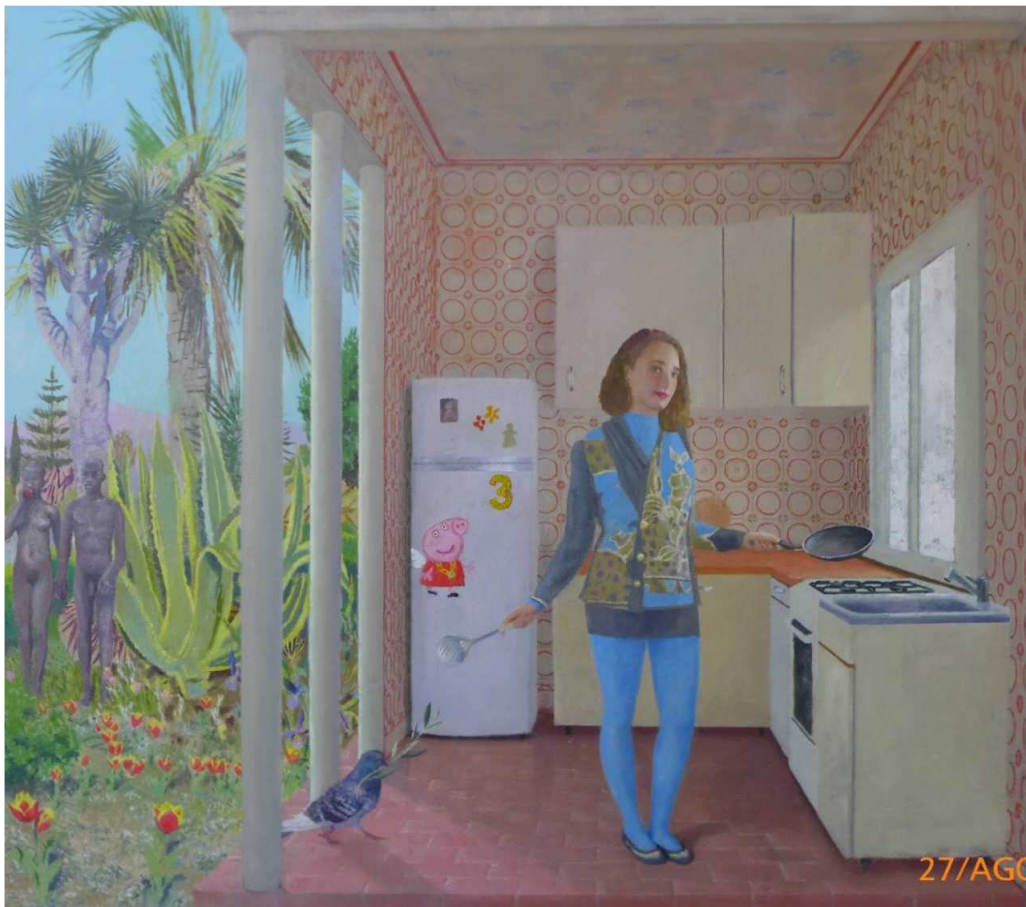
Anunciacion , 2021, hst, 117x132 cm