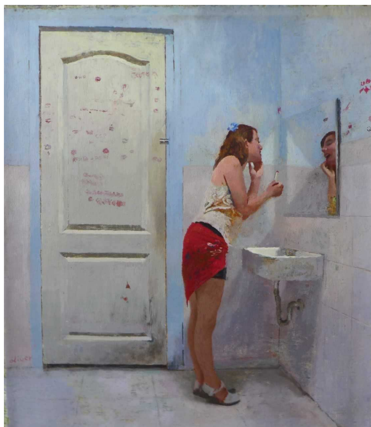
Toilette Paradise , 2018, hst, 72x 63 cm

Mais venez voir et, croyez moi, cela ne saurait plus tarder à se savoir !