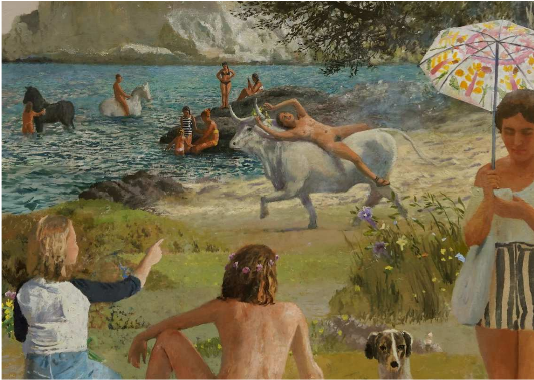
El rapto de Europa , un détail, 2021, hst, 200x200cm

Vernissage le jeudi 9 septembre de 18 à 21 heures en présence de Miguel