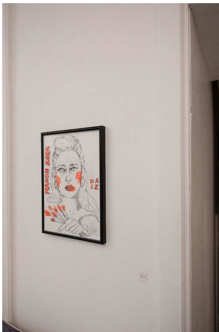
Original de la couverture in situ, puis deux vues de l'accrochage