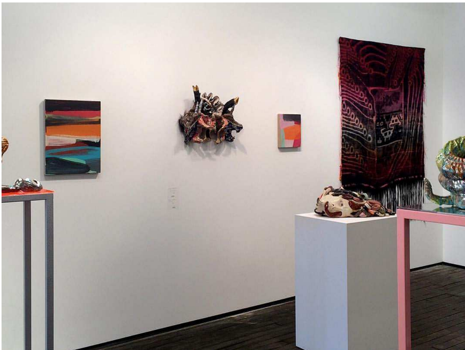
Vue large stand 2 e accrochage

Mathilde Hatzenberger Gallery Rue Washington, 145 1050 Bruxelles / Belgium +32 (0)478 84 89 81 / www.mathildehatzenberger.eu