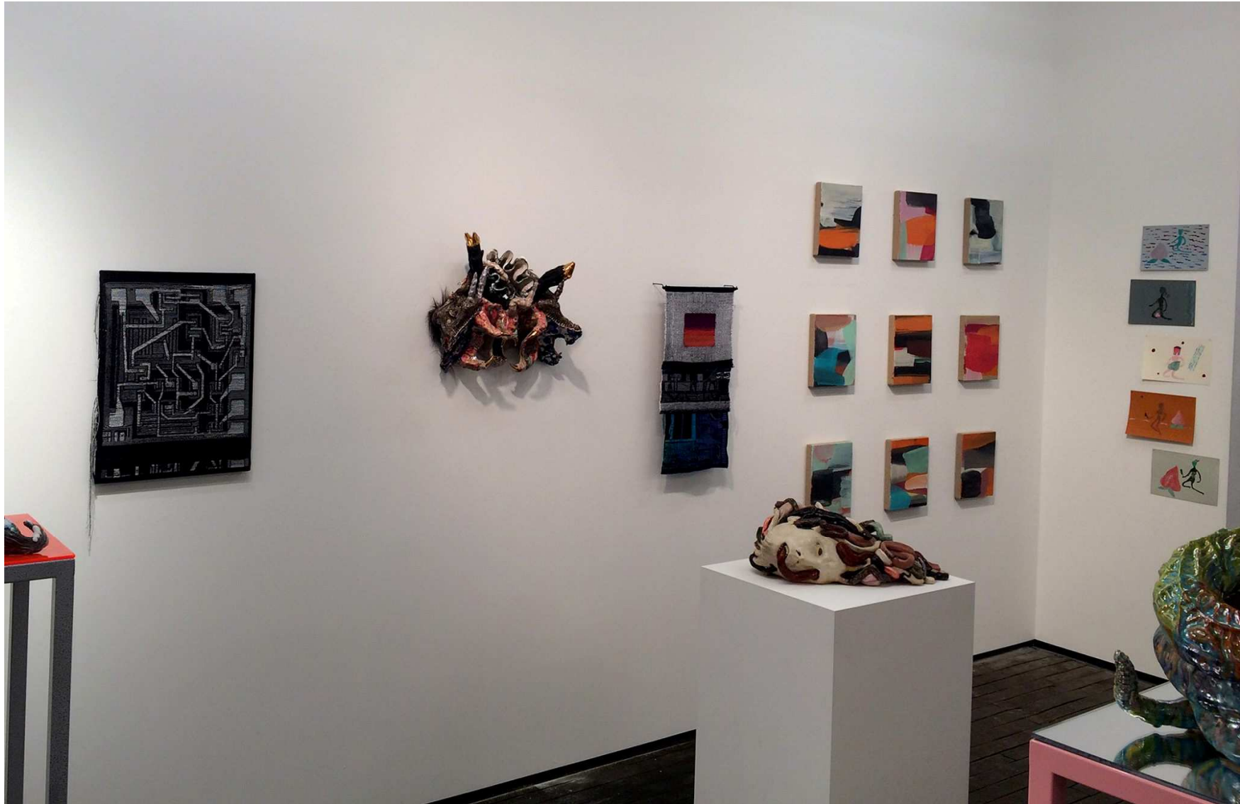
Vue Targe Jour J

Mathilde Hatzenberger Gallery Rue Washington, 145 1050 Bruxelles / Belgium +32 (0)478 84 89 81 / www.mathildehatzenberger.eu