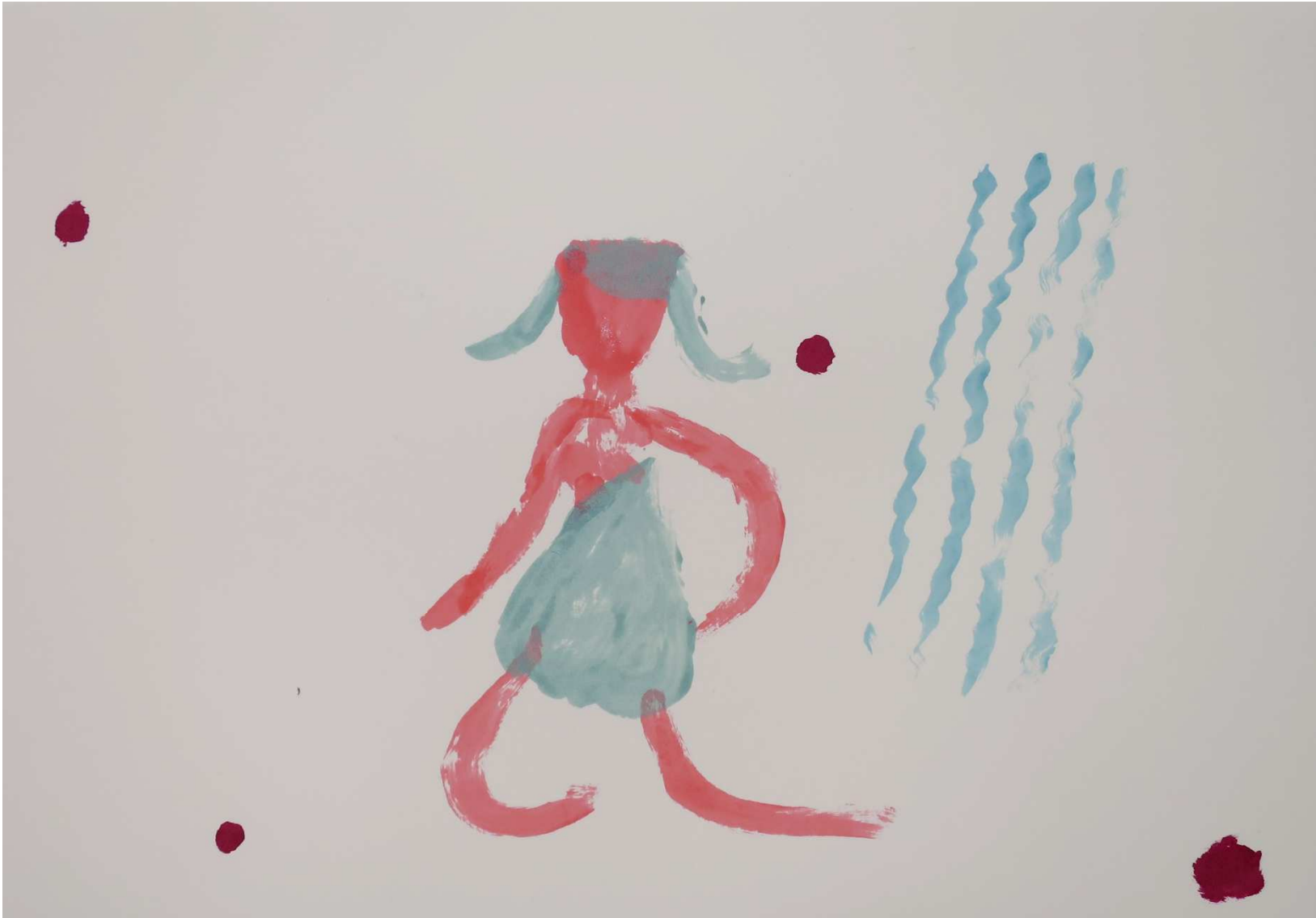
Yoshie SUGITO, Peach boy #6 , 2016, vernis à ongle sur papier, 21x29,7 cm

Mathilde Hatzenberger Gallery Rue Washington, 145 1050 Bruxelles / Belgium