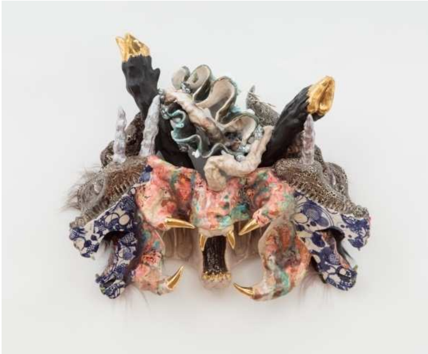
Roxanne JACKSON, Skull polishing , 2015, 66x25,4x35,6 cm

Mathilde Hatzenberger Gallery Rue Washington, 145 1050 Bruxelles / Belgium +32 (0)478 84 89 81 / www.mathildehatzenberger.eu