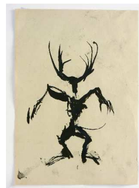
Cerf debout , 2016

Dans un rapport plus intime et plus simple pour le spectateur, force sera donc de constater quel que soit le lieu, Glowinski livre toujours des combats risqués, y compris avec un simple crayon ou pinceau, et une petite feuille. Une gageure que l'artiste s'était jusque-là épargnée.