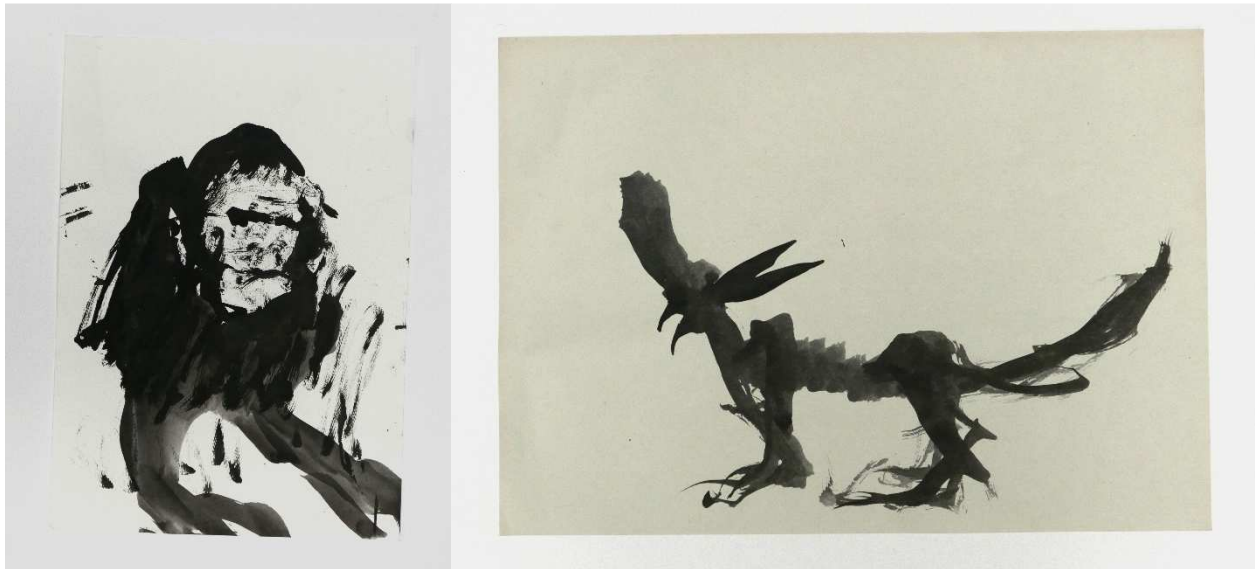
Gorille , 2014 et Loup , 2015, encre sur papier, chaque A4