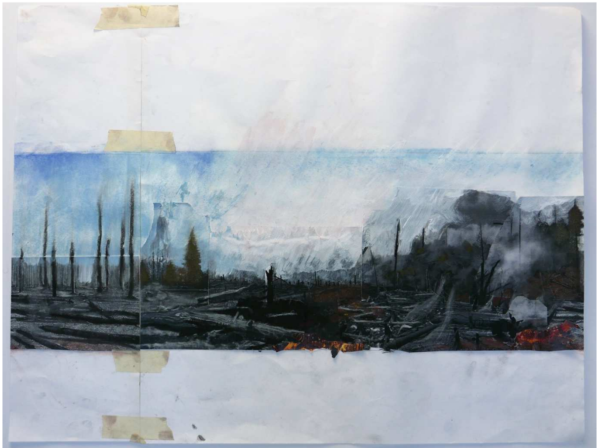
Maquette Forêt calcinée , 2016, collage rehaussé, 50x65 cm