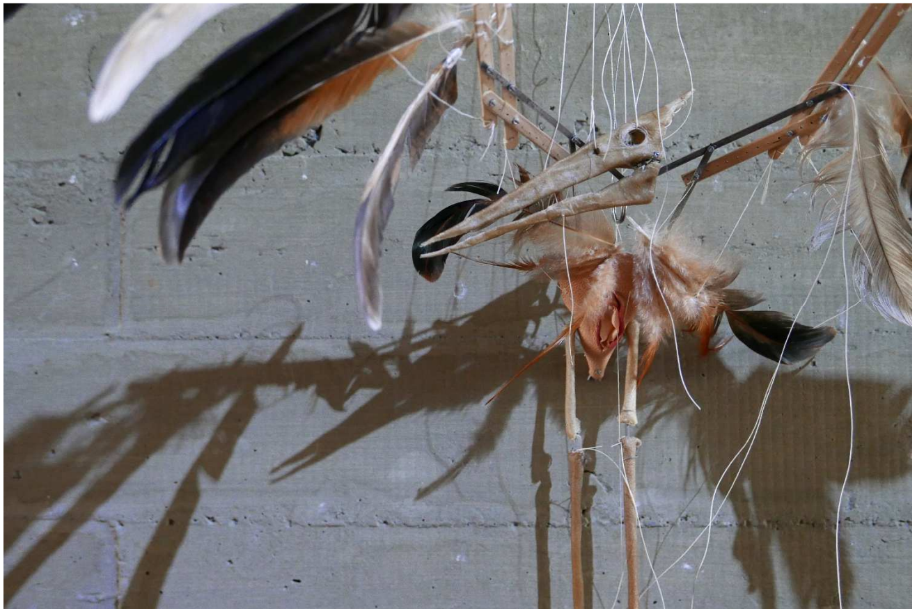
Marionnette La grande , 2017

Mathilde Hatzenberger Gallery Rue Washington, 145 / 1050 BRUXELLES +32 (0)478 84 89 81 / www.mathildehatzenberger.eu