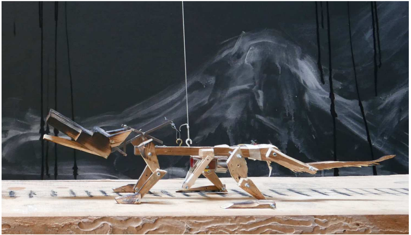
Marionnette Loup , 2015