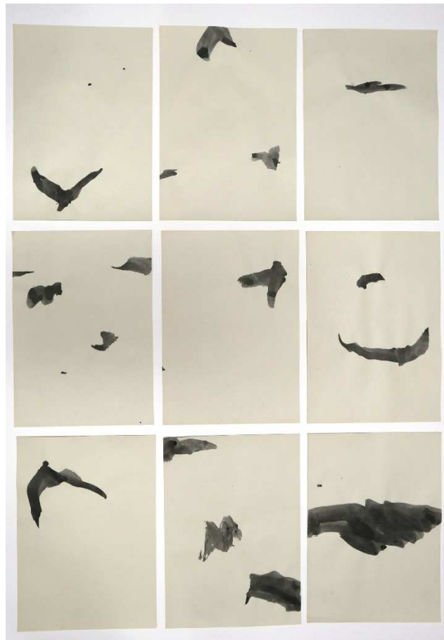
Oiseaux , 2018, polyptique à l'encre, 9 x A4